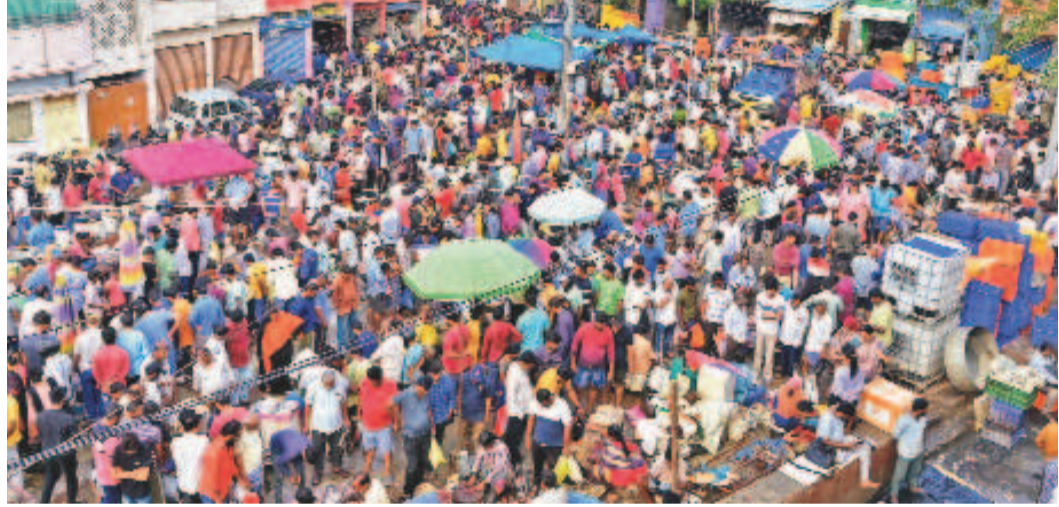
హైదరాబాద్ లోని ముషీరాబాద్ చేపలమార్కెట్ అవివారం కోసుగోలుదారులతో కిటికీలూడింది. మృగశిర కార్తె సందర్భంగా గత మూడు రోజుల్లో వంద టన్నుల చేపలు అమ్ముడవగా, అవివారం ఒక్కరోజే రికార్డు స్థాయిలో 50 టన్నులు చేపలు అమ్ముడవడం చూడవచ్చు