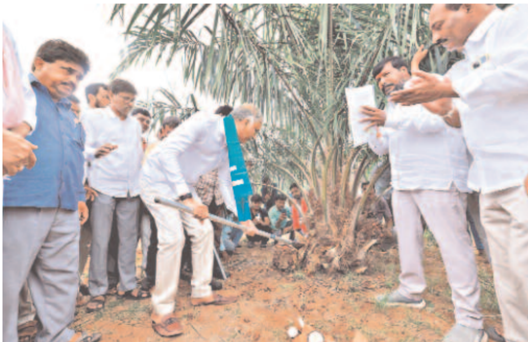
సిద్దిపేట జిల్లా అగ్రికల్చరల్ గ్రామంలో రైతు తిప్పని నాగేందర్ ఆయిల్ పామ్ తోటలో కొత్తకాయలు కోట్ల మొదటి వంట గెలుపు మాజీ మంత్రి, సిద్దిపేట ఎమ్మెల్యే హరీశ్ రావు