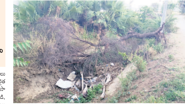
పెగడపల్లిలో పచ్చి మొక్కలతో అధ్యానంగా ఉన్న ఎస్సార్ సీ డీ-76, 77 ప్రధాన కాలువ

పెగడపల్లి, జూన్ 9: ఎస్సార్ సీ కాలువలు అధ్యానంగా మారాయి. దశాబ్దాలుగా రైతల స్వేచ్ఛకు అడ్డంకంగా మారి, సాగుకు భరోసా ఇచ్చిన కెనాళ్లు ప్రస్తుతం పూడికతో నిండి, ఈత, తాటి, తుమ్మ, పిచ్చి చెట్లు పెరిగిపోయి ఆనవాళ్లు కోల్పోయాయి. ప్రధానంగా పెగడపల్లి మండలంలోని డీ-76, 77 కెనాళ్ల డిస్ట్రిబ్యూషన్ లైన్లు అధ్యానంగా మారడంతో సాగుకు నీటి సరఫరాకు ఉన్న మార్గాలన్నీ మూసుకుపోయాయి. వివరాల్లోకి వెళితే.. పెగడపల్లి మండలంలో సాగుకు ఎస్సార్ సీ నీటి ఆధారం. దాదాపు 21 గ్రామాలలోని వెలాది ఎకరాల్లో ఒకప్పుడు పుష్పలంగా నిరండంది.