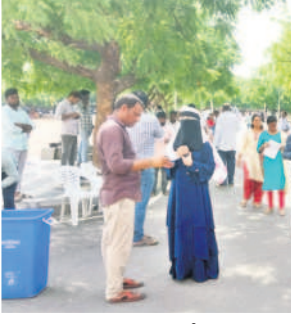
తిమ్మాపూర్ : వాగ్శృంగోలో అభ్యర్థులను తనిఖీ చేస్తున్న సిబ్బంది