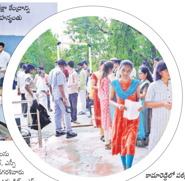
కామారెడ్డిలో పరీక్షా కేంద్రం వద్ద అభ్యర్థులను తనిఖీ చేస్తున్న సిబ్బంది