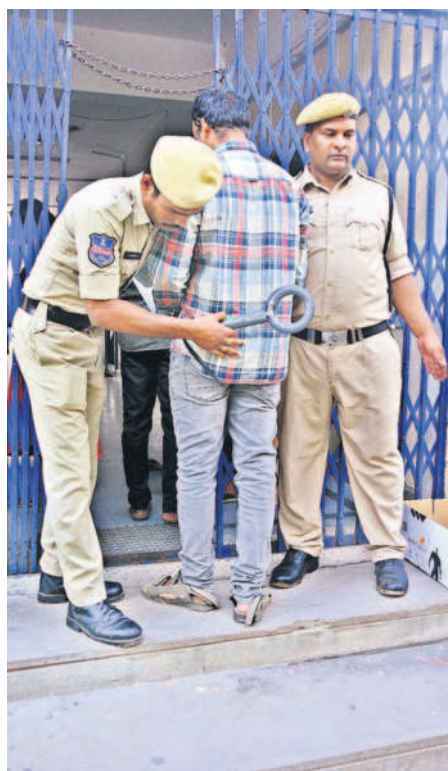
నిజామాబాద్ లోని ఓ పరీక్షా కేంద్రం వద్ద అభ్యర్థులను క్లుప్తంగా తనిఖీ చేస్తున్న పోలీసులు