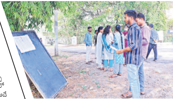
కామారెడ్డిలో పరీక్షా కేంద్రం వద్ద హాల్ కెట్ నంబర్లను చూసుకుంటున్న అభ్యర్థులు