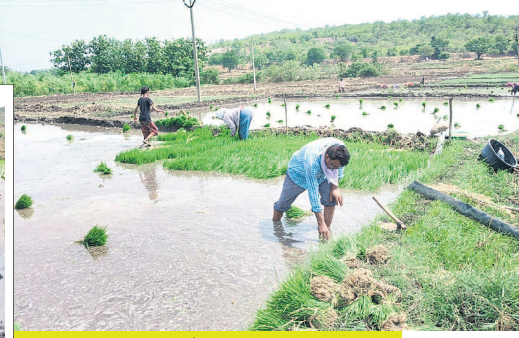
మల్కాపూర్ తండాలో వరినాట్లు వేస్తున్న రైతులు