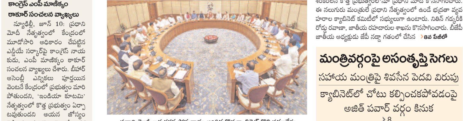
ప్రధాని మోదీ అధ్యక్షతన సోమవారం జరిగిన కొత్త క్యాబినెట్ తొలి సమావేశం

కిషన్ రెడ్డికి బొగ్గు, గనులు.. రామ్మోహన్ కు విమానయానం బండి సంఘానికి హోం మంత్రిత్వ శాఖ సహాయ బాధ్యతలు క్యాబినెట్ భేటీ.. కిసాన్ సమ్మాన్ పై మోదీ 3.0 తొలి సంతకం