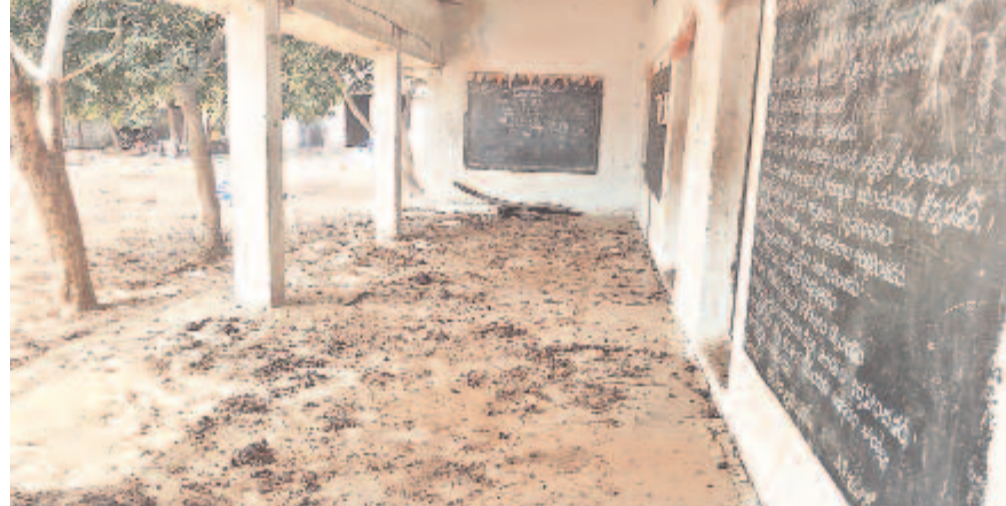
రేవంత్ నుంచి కొత్త విద్యాసంవత్సరం ప్రారంభం కానుండగా.. బడులన్నీ ముస్తాబువుతున్నాయి. కానీ అసిపాబాద్ జిల్లా చింతలమానేపల్లి మండలం గంగాపూర్ లోని ప్రభుత్వ పాఠశాల మాత్రం నిర్దుహణ వైఫల్యంతో ఇలా తయారైంది. పాఠశాలలోని నాలుగు గదులకుగానూ రెండింటిని మిషన్ భగీరథ కోసం వాడుతున్నారు. చెత్తాచెదారంతో దుర్భరంగా మాలిన ఇక్కడే ఈ నెల 8న బడిబాట కూడా ప్రారంభమైంది.