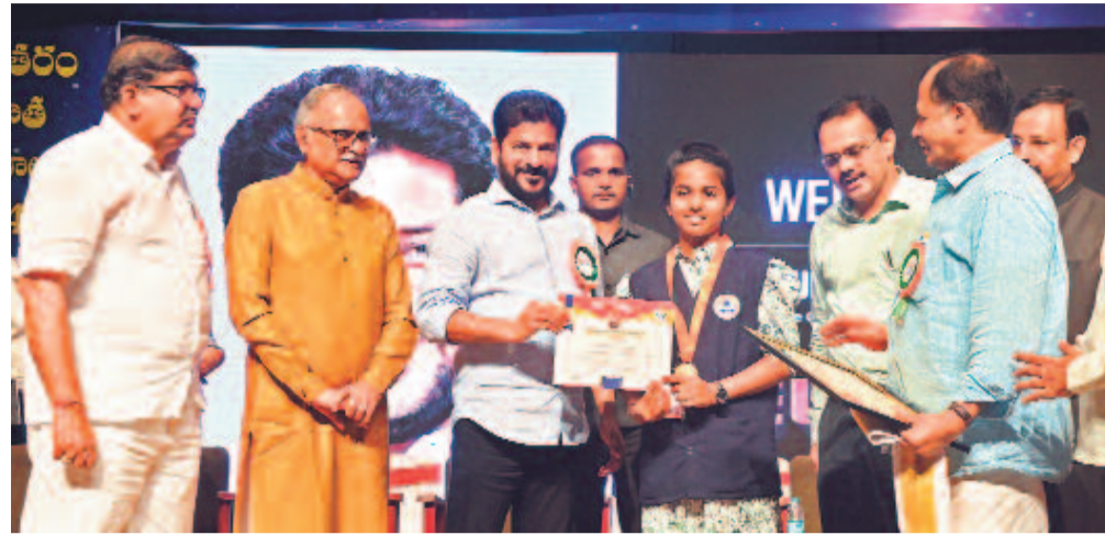
సోమవారం రవీంద్రభారతిలో వందేమాతరం పాండేషన్ అధ్యక్షులతో జరిగిన కార్యక్రమంలో పదోతరగతిలో 10జేపీపీ సాధించిన ప్రభుత్వ పాఠశాల విద్యార్థినికీ ప్రతిభా పురస్కారాన్ని అందజేస్తున్న ముఖ్యమంత్రి రేవంత్ తోపాటు