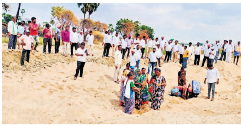
రాంబోజీగూడెం వారులో ఇసుకను పలికిలిస్తున్న రైతులు, బీఆర్ఎస్ నాయకులు