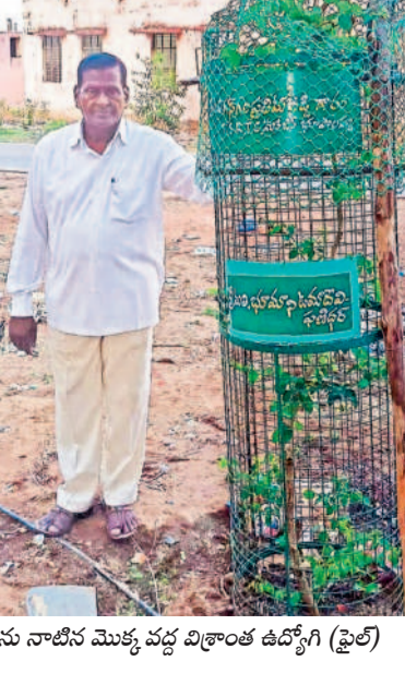
తన నాటి మొక్క వద్ద విశ్రాంత ఉద్యోగి (ఫ్రైల్)

వివిధ రకాల 30 మొక్కలను నాటి వాటిని కంటికిపెచ్చులా కాపాడుతున్నారు. సకాలంలో నీరందిస్తూ, పశువుల బారిన పడకుండా ప్రతి మొక్కకు డ్రాఫ్టులను ఆమర్చడంతో ఇప్పటికే ఏడుగురు మొక్కలు తరలింపబడ్డాయి. మొక్కలకు ఏకాగ్రత చూపించి వాటిని పెంచుతున్నారు. అలాగే ప్రయాణికుల సౌకర్యార్థం ప్రత్యేకంగా మహాదేవపూర్ బస్స్టాండ్ అవరణలో 12 బెంచీలు ఏర్పాటు చేశారు. మహిళా డినోచేషన్ సంఘం వారు మోహన్ రంగాల్లో సేవలందించిన మహిళా ఉద్యోగాలను సన్మానిస్తున్నారు. ఇలా విశ్రాంత ఉద్యోగులు చేస్తున్న కృషి ప్రతి ఒక్కరినీ ఆలోచింపజేస్తూ సమాజంలో పౌరుల బాధ్యతను గుర్తు చేస్తున్నదండం అతిశయోక్తి లేదు. మెరుగైన సమాజ నిర్మాణానికి యువత నడుం బిగించాలని, ప్రతి ఒక్కరు మొక్కలు నాటాలని పిలుపునిస్తున్నారు. ఇలా వారు చేస్తున్న సేవలను పలువురు అభినందిస్తున్నారు.