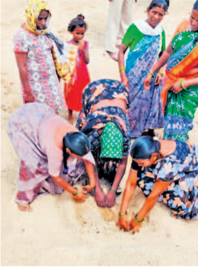
వారులో ఇసుక తోడిన బోట్లు మట్టి తీసిన ప్రాంతాన్ని చూపుతున్న మహిళలు

దేవరపల్లె, జూన్ 10 : దేవరపల్లె మండలం రాంబోజీగూడెం, గోల్లపల్లి వారుల నుంచి ఇసుక తరలింపును నిలిపివేయాలని తిరుగుబాటు చేశారు. ఇసుక తరలింపును వెంటనే ఆపాలని వందలాది మంది వారు పరివహార రైతులు సోమవారం బీఆర్ఎస్ నేతృత్వంలో జనగామ కలెక్టరేట్లో నిర్యంతనానంద్ గ్రూప్ కు తరలింపును నిలిపివేయాలని కోరారు. ఈ నేపథ్యంలో పాతకర్మి, చెన్నూరు రిజర్వాయర్ నిర్మాణం కోసం ఇసుక తరలిస్తే భూగర్భ జలాలు అడుగుంటే పాంటి పాలాలు ఎండిపోతున్నాయని మహిళా రైతులు అధికారులతో వాగ్వాదానికి దిగారు. చెన్నూరు రిజర్వాయర్ కోసం రాంబోజీగూడెం చెక్ డ్యాం నుంచి 5 వేలు, పాలకర్మి రిజర్వాయర్ కోసం గోల్లపల్లి చెక్ డ్యాం నుంచి మరో 5 వేల క్యూబిక్ మీటర్ల ఇసుక తరలిస్తే తమ ప్రాంతం ఎడారిగా మారుతుందని రైతులు ఆవేదన వ్యక్తం చేశారు.