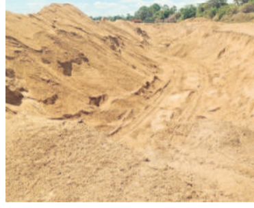
లోతుగా వేపట్టిన తవ్వకాలు

ఏటూరనాగారం, జూన్ 10 : పంటలు సాగు చేసే భూముల కంటే ఇసుక మేటలు వేసిన పల్లూ భూములకు ప్రస్తుతం డిమాండ్ ఉన్నది. ఎకరానికి సుమారు లక్ష రూపాయల వరకు కొలు చెల్లించేందుకు దళారులు, కాంట్లాక్టర్లు ముందుకు వస్తుండడంతో రైతులు వారి పై మొగ్గు చూపుతున్నారు. ఎకో సెన్సిటివ్ జోన్ పేరుతో మూడేళ్లగా ఇసుక మేటలు తొలగింపును అటవీశాఖ అధికారులు ఆడ్డుకున్నా. ఇటీవల మళ్ళీ మొదలైంది. రెండు నెలల నుంచి తొలగింపు ప్రక్రియ జోరుగా సాగుతుండడంతో దళారులు, కాంట్లాక్టర్లు అలాంటి భూముల కోసం వెతుకుతున్నారు. మొదట కాంట్లాక్టర్లు, దళారులు ఇసుక మేటలు వేసిన భూములను రైతులతో ఒప్పందం కుదుర్చుకొని, ఇసుక మొత్తం తీసే వరకు అనుమతి పొందుతారు. ఇందుకు ఏడాది నుంచి మూడేళ్ల పట్ల అవకాశం ఉన్నది. గతంలో ఎకరానికి రూ.80 వేల వరకు కొలు చెల్లిం చగా, ఈ ఏడాది తాజాగా రూ.లక్ష వరకు ఇస్తామంటూ రైతులతో అగ్రి మెంట్ రాయించుకుంటున్నారు. అయితే, కొంతమంది దళారులు కొలుకు తీసుకుని డబ్బులు సరిగ్గా చెల్లించకుండా ఇబ్బంది పెడుతుం డడడంతో అనేక చోట్ల రైతులు ఇసుక తొలగింపును ఆడ్డుకున్న పుటలను కూడా ఉన్నాయి. ఏటూరునాగారం, తాడ్యాయి, మంగిపేట, వాజిడు, వెంకటాపురం, కన్నాయిగుడెం మండలాలలో వేల ఎకరాల్లో ఇసుక మేటలు వేసిన భూములు ఉన్నాయి. ఇప్పట్నవారుతో పాటు అనేక వారులు, గోదావరి కోతకు గురైన భూములు ఇసుక మేటలతో ఉన్నా