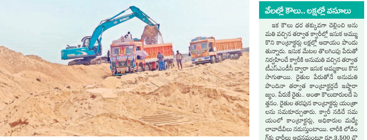
మేట వేసిన పంట భూముల్లోని ఇసుకను లాల్లిలో లోడ్ చేస్తున్న పొక్లయినర్