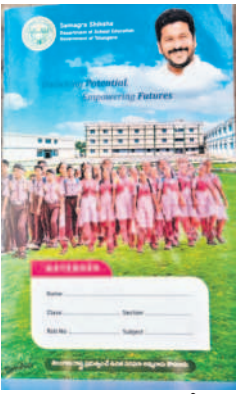
విద్యార్థులకు పంపిణీ చేయనున్న నోట్ బుక్కులు

మక్రల్ టౌన్, జూన్ 10 : ప్రభుత్వ పాఠశాలల్లో చదివే విద్యార్థులకు మొదలైన విద్యను అందించాలనే సంకల్పంతో ప్రభుత్వం అరు నుంచి పదో తరగతి విద్యార్థులకు పాఠ్యపుస్తకాలు అందించడమే కాకుండా నోట్ బుక్కులు అందించేందుకు సిద్ధమైంది. వీటిని పంపిణీ చేసేందుకు ఇప్పటికే జిల్లా విద్యాశాఖ కార్యాలయం నుంచి అయా ఎమ్మార్వీ కార్యాలయాలకు తరలింపారు. నారాయణపేట జిల్లాలో 378 ప్రభుత్వ పాఠశాలలు ఉండగా.. అందులో 76 ఉన్నత పాఠశాలలు, 11 కస్తూర్బాగండ్రి విద్యాలయాలు, రెండు మోడల్ స్కూళ్లు కలిపి మొత్తం 38 వేల మంది విద్యార్థులు ఉన్నారు. వీరి కోసం ప్రభుత్వం