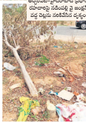
అచ్చంపేట-హైదరాబాద్ ప్రధాన రహదారిపై నడిపల్లి వైజెఎస్ కోట్ వద్ద చెట్లను నరికివేసిన దృశ్యం

అచ్చంపేట రూరల్, జూన్ 10 : నాటి కేసీఆర్ ప్రభుత్వం పడేండ్ల పాలు చర్యలను పరిరక్షణకు అదిక ప్రాధాన్యమిస్తూ మానవులకాగా పిలువబడే హరితహారానికి శ్రీకారం చుట్టారు. రహదారుల వెంట మొక్కలను నాటేందుకు గ్రామాలు, ముఖ్యంగా మార్కెట్ అధికారుల వైఖరి మారడం అచ్చంపేటలో చర్యనియోగంగా మారింది. ప్రజాధనంతో చేసిన పనిని నిర్వీర్యం చేయడంపై ప్రభుత్వ హయాంలో మహబూబ్ నగర్ - హైదరాబాద్ ప్రధాన రహదారి, నడిపల్లి వైజెఎస్ కోట్ పాటు ఉప్పునంతల - హైదరాబాద్ రహదారిపై ప్రభుత్వ హయాంలో మహబూబ్ నగర్ కులను నాటిచగా గ్రామాలకు వెళ్లి విద్యుత్ స్తంభాల వైర్లకు అడ్డంగా