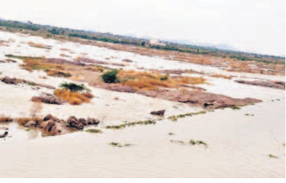
ఆర్డీఎస్ అనకట్లపై పారుతున్న వరద

మక్రల్, జూన్ 10 : ఎగువ ప్రాంతం నుంచి కృష్ణానదికి వరద వస్తుండడంతో నదిలో నీటి మట్టం క్రమక్రమంగా పెరుగుతున్నది. మూడు రోజుల నుంచి వరద నిలకడగా వస్తుండడంతో రైతులు ఆనందం వ్యక్తం చేస్తున్నారు. కృష్ణానది నుంచి దిగువన నీరు రాకుండా ఆడ్డుకునేందుకు కర్ణాటక రాష్ట్రం రాంపూర్ జిల్లా బీర్హాపూర్ వద్ద రోడ్డుకం బ్యారేజీ నిర్మించారు. అయితే ఎగువ నుంచి భారీగా వరద వస్తుండడంతో సోమవారం బీర్హాపూర్ బ్యారేజీ గేట్లు తెరవడానికి అధికారులు ప్రయత్నించినప్పటికీ గేట్లు మొరాయింపాయి. దీంతో వరద నీరు చట్టద్రవై నుంచి సిల్వోనే ద్వారా దిగువకు వస్తుండడంతో ఎప్పుడు ఏం జరుగుతుందోనని అక్కడి ప్రజలు భయాందోళనకు గురవుతున్నారు. ఎగువన భారీ వర్షాలు కురుస్తుండడంతో మరో రెండు మూడు రోజుల్లో కృష్ణమ్మకు వరద పోతే అవకాశం ఉందని నీటి పారుదల శాఖ అధికారులు తెలిపారు.