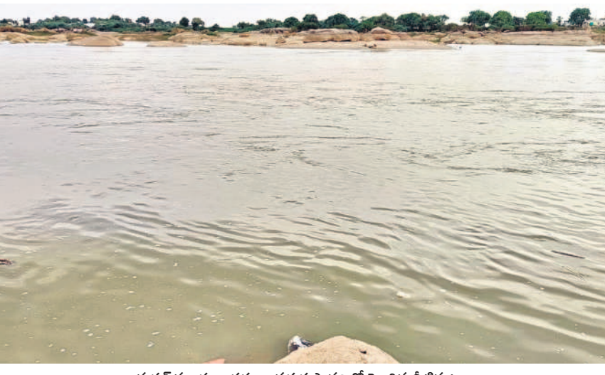
మక్రల్ మండలం వస్తుల వద్ద కృష్ణానదిలో పెరిగిన నీటిమట్టం