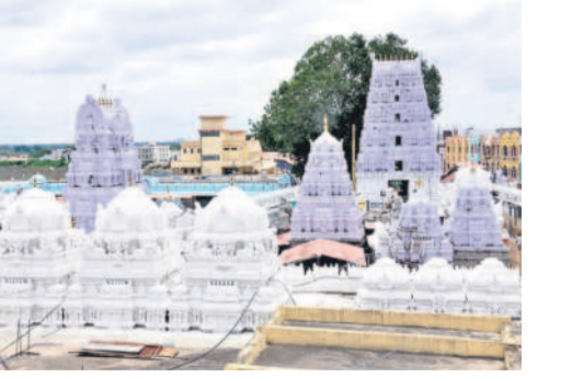
కమిషనర్ రావణమ లలస్యం

వేములవాడ, జూన్ 10: దేవాదాయ శాఖలో ఉద్యోగుల బదిలీల వ్యవహారం ఉత్కంఠ రేపిస్తున్నది. గత నెల 21న నిర్వహించిన సమావేశంలో అలయాల్లో తీర్పు చేసిన ఉద్యోగులకు బదిలీ తప్పని సరి అని రాష్ట్ర దేవాదాయ శాఖ మంత్రి కోడ నారాయణ స్వయంగా సేవలందించే కోడ్ ముగియగానే బదిలీలు ఉంటాయని పరోక్షంగా ఉద్యోగులకు సంతకాలు కూడా అందాయి. ఇప్పటికే అలయాల్లో పనిచేస్తున్న ఉద్యోగుల వివరాలను కూడా దేవాదాయ శాఖ ఉన్నతాధికారులు సంబంధిత అలయాల నుంచి సేకరించారు. అయితే, బదిలీల ప్రక్రియపై రాష్ట్రంలో నిషేధం ఉండగా దానిని ఎత్తివేసి బదిలీలు చేపడతారన్న సమాచారం ఇటు రాజన్న అలయ ఉద్యోగుల్లోనూ ఆందోళన రేపిస్తున్నది. మరోవైపు బదిలీలు అమలవుతున్నాయి. ఎమ్మెల్యేలకు ధర్మా దేవాదాయ శాఖ ఉద్యోగులు ప్రదక్షిణ చేస్తున్నప్పటికీ బదిలీలు దాదాపు అయిపోయినట్లుగానే తెలుస్తున్నది.