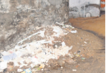
వనపర్తి తెలుగువాడి స్కూల్ ఆవరణలో మట్టి

పథకపు పనులు, బదిలీలపై దృష్టి సారించడంతో పాఠశాలలకు ఆరంభంలోనే అలంకారాలు కలగనున్నాయి. ప్రభుత్వం చేస్తున్న బడిబాట ఈనెల 6 నుంచి ప్రారంభమై 19వ తేదీ వరకు జరగాల్సి ఉండగా.. ఈ కార్యక్రమం మొత్తంబడిగా సాగుతున్నది. ఉపాధ్యాయులంతా తమకు ఏ స్థానాల్లో పోస్టింగ్ వస్తుందోనన్న ఆందోళనలో ఉంటున్నారు. ఇక పూర్తిస్థాయిలో పుస్తకాలు, నోటుబుక్కులు మండలాలకు చేరలేదు. ఈ విద్యార్థుల సంవత్సరం పాఠశాలల బడి వేళలు మారగా.. ఉదయం 9 గంటలకే ప్రారంభం కానున్నాయి. గ్రామాల నుంచి పూర్తి స్థాయిలో బస్సు రవాణా లేకపోవడం ఇబ్బందిగా మారే అవకాశం ఉన్నది. ఇక ప్రతి