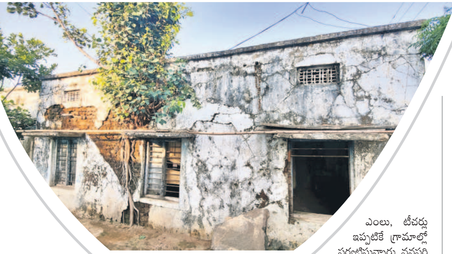
శిథిలావస్థలో ఉన్న పాఠశాల భవనం గోడలో పెరిగిన చెట్టు

మారడంతో పనులు జరగలేదు. ప్రస్తుతం అమ్మ ఆదర్శ పాఠశాలకు ఎంపికైనది. అయితే ప్రస్తుతం వర్షాలం ప్రారంభం కావడంతో ముప్పు పొంది ఉన్నది. నేటి నుంచి పాఠశాలలు పునఃప్రారంభంకానున్న సమయంలో ఎప్పుడు ఏ ప్రమాదం జరుగుతుందోనని విద్యార్థులు, వారి తల్లిదండ్రులు భయాందోళన వ్యక్తం చేస్తున్నారు.