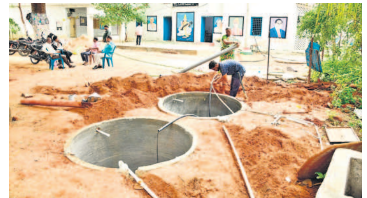
మహబూబ్ నగర్ గాంధీనగర్ రోడ్డు హైస్కూల్లో పనులు చేపడుతున్న కూలీలు

నాలుగో శనివారం నోట్ బుక్ డే అమలు కానున్నది. అలాగే ప్రతిరోజూ దిగంబట పాటు పాఠ్యపుస్తకాల పతనం, కథల పుస్తకాలు, దినపత్రికలు, మ్యాగజైన్లు వదిలివేసేందుకు నిర్ణయించింది. పదో తరగతి విద్యార్థులకు 2025 జనవరి 10వ తేదీ నాటికి సెలబ్స్ పూర్తి చేసి రివిజన్ తరగతులు నిర్వహించనున్నారు. ఫిబ్రవరి 28 వరకు 9వ తరగతి విద్యార్థుల సెలబ్స్ పూర్తి చేసి రివిజన్ చేయనున్నారు. అలాగే పాఠశాలల్లో యోగా, మెడిటేషన్ తరగతులు నిర్వహించాలని సర్కారు నిర్ణయించింది. కాగా పాఠశాలల్లో సమస్యలు ఎప్పుటిలాగే ఉన్నాయి. టీఆర్ఎస్ హయాంలో చేపట్టిన 'మనఊరు-మనబడి' పనులు నిర్వహణ అటకెక్కింది. దీని స్థానంలో తీసుకొచ్చిన 'అమ్మ ఆదర్శ' పాఠశాల పథకం పేరుకు మాత్రమే అమలువుతున్నది. మన ఊరు-మనబడి పథకంలో భాగంగా ఎంపిక చేసిన స్కూళ్లలో రూ. లక్షలు వెచ్చించి అభివృద్ధి చేయాలి. అమ్మ ఆదర్శ పాఠశాలల కింద రూ. 25వేలతో పనులు చేపట్టడం స్కూల్ నిర్వహణపై ప్రభుత్వ చిత్తశుద్ధి తెలియజేస్తున్నది. చాలా స్కూళ్లలో మూత్రశాలలు, మరుగుదొడ్లు సక్రమంగా లేవు. పలు పాఠశాలలు శిథిలావస్థకు చేరి వెచ్చబాడే దశలో ఉన్నాయి. మొత్తం మీద ఈ విద్యార్థుల సంవత్సరం విద్యార్థులకు పలు సమస్యలతో స్వాగతం పలుకుతున్నది.