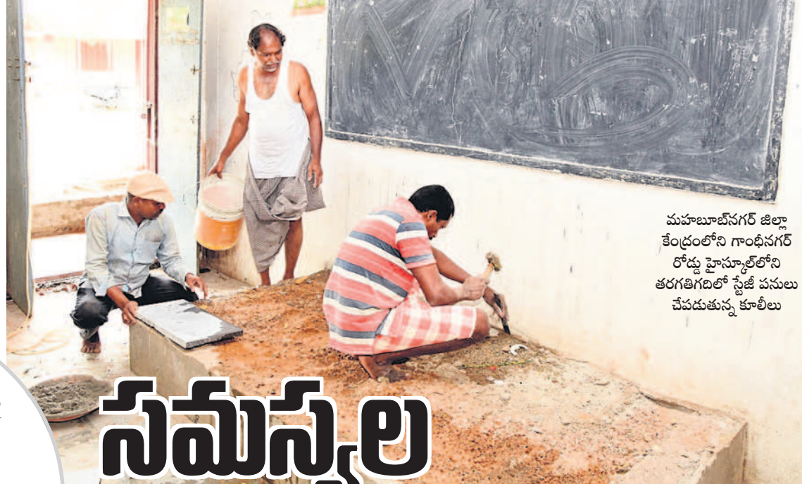
మహబూబ్ నగర్ జిల్లా కేంద్రంలోని గాంధీనగర్ రోడ్డు హైస్కూల్లోని తరగతిగదిలో స్ట్రెజ్ పనులు చేపడుతున్న కూలీలు

నేటి నుంచి బడులు పునఃప్రారంభం కానున్నాయి. బడిగంట మోగేందుకు వేళైనా.. పలు పాఠశాలలు సమస్యలతో స్వాగతం పలుకుతున్నాయి. కొత్త విద్యార్థులను తరం కోటి ఆశలతో తల్లిదండ్రులు వారి పిల్లలను స్కూళ్లకు పంపించేందుకు సిద్ధమయ్యారు. కానీ సవాళ్ల మధ్య చదువులు సక్రమంగా సాగినా.. అన్న అనుమానాలు వ్యక్తమవుతున్నాయి. కేసీఆర్ ప్రభుత్వ హయాంలో కొనసాగిన మన ఊరు-మన బడి కార్యక్రమం అటకెక్కా.. ప్రస్తుత ప్రభుత్వం తీసుకొచ్చిన అమ్మ ఆదర్శ పాఠశాల పనులు ముందుకు తీసుకుపోలేదు. దీంతో నాడు కళకళ లాడిన బడులు నేడు వసతులు కరువై వెలవెలబోతున్నాయి. దీనికోసం బదులు ప్రారంభంలోనే ఉపాధ్యాయ బదిలీల ప్రక్రియ తెరవైకి రావడంతో చదువులూ సాగుతాయేమోనన్న అయోమయం తల్లిదండ్రుల్లో నెలకొన్నది.