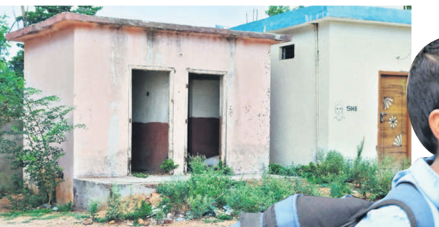
కామారెడ్డి బాలర పాఠశాలలో ధ్వంసమైన మరుగుదొడ్ల తలుపులు

ప్రభుత్వ పాఠశాలల్లో అవసరమైన మౌలిక వసతులు, మరమ్మత్తులు చేయించేందుకు ప్రభుత్వం అమ్మ ఆదర్శ కమిటీలను ఏర్పాటు చేసింది. నిధులు సైతం విడుదల చేసింది. కానీ కాంట్రాక్టర్ల నిర్లక్ష్యమే.. అధికారుల పర్యవేక్షణ లోపమే కానీ అసంపూర్ణ పనులతో విద్యార్థులకు స్వాగతం చలుకుతున్నాయి. సాక్షాత్ కలెక్టర్ తోపాటు డీఈవో సైతం తనిఖీలు చేస్తూ పనులు త్వరగా పూర్తిచేయాలని ఆదేశించినా సత్వరకరణ సాగుతున్నాయి. కొన్ని పాఠశాలలను మాస్కోలో తల్లిదండ్రులు భయాందోళన చెందుతున్నారు. చెళ్ళాచెడారంతోపాటు పిల్లమొక్కలతో దర్భనుమున్నాయి. మరుగుదొడ్లు, తాగునీటి సౌకర్యం ఇంకా పూర్తికాలేదు. పలుచోట్ల ప్రచారాలు కూలిపోవడం, తలుపులు ధ్వంసమై కనిపిస్తున్నాయి. మరికొన్ని పాఠశాలలకు వైకుంఠ కూడా వేయలేదు.