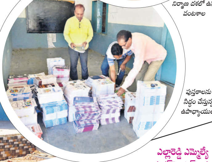
పుస్తకాలను సిద్ధం చేస్తున్న ఉపాధ్యాయులు