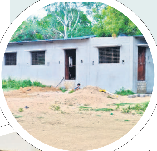
నిర్మాణ దశలో ఉన్న పంటశాల