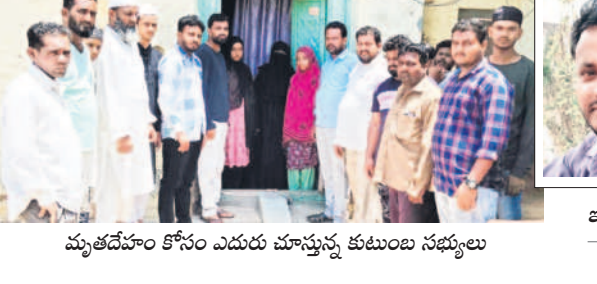
మృతదేహం కోసం ఎదురు చూస్తున్న కుటుంబ సభ్యులు