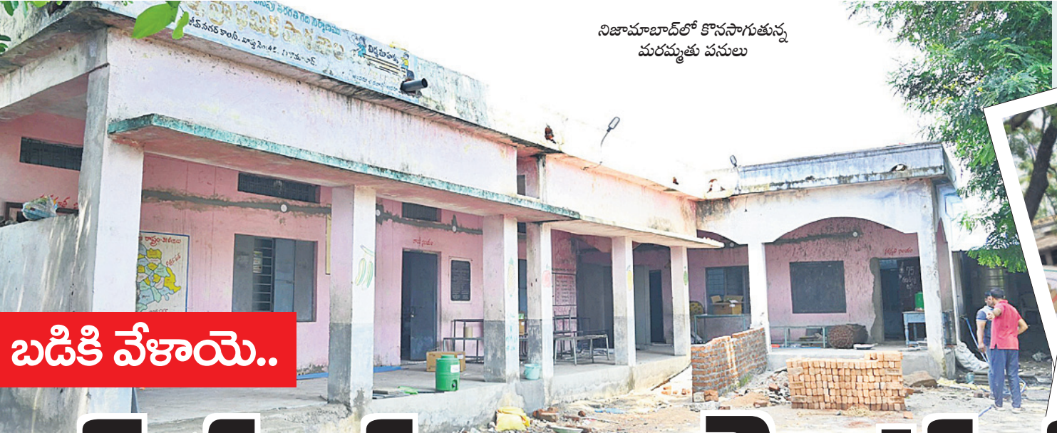
నిజామాబాద్లో కొనసాగుతున్న మరమ్మత్తు పనులు