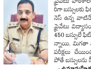
జిల్లా ట్రాన్స్ పోర్ట్ ఆఫీసర్, నిజామాబాద్

నెలసెక్కు నుంచి వేసవి సెలవులు ప్రకటించడంతో పాఠశాలలు మూతబడ్డాయి. బుధవారం ప్రభుత్వ ప్రైవేటు పాఠశాలలను ప్రారంభం కానుండడంతో పాఠశాలలను శుభ్రం చేయిస్తున్నారు. విద్యార్థులకు ఎలాంటి అపాయనాలు లేకుండా అన్ని ఏర్పాట్లు చేస్తున్నాం.