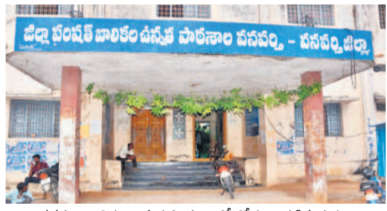
వనపర్తి బాలికల ఉన్నత పాఠశాలలో తోరణం కట్టిన దృశ్యం

వనపర్తి టౌన్/నారాయణపేట రూరల్/గద్దాలటౌన్/పాలమూరు, జూన్ 11 : నేటి నుంచి బడిగంట మోగనున్నది. ఈనెల 6 నుంచి బడిబాట ప్రారంభమవుతూ... హెన్