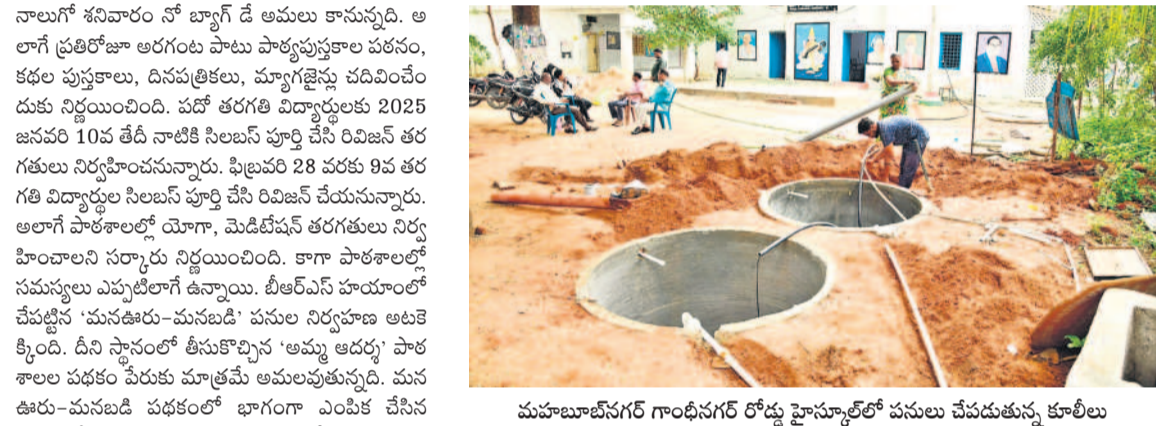
మహబూబ్ నగర్ గాంధీనగర్ రోడ్డు హైస్కూల్ లో పనులు చేపడుతున్న కూలీలు

నాలుగో శనివారం నో బ్యాగ్ డే అమలు కానున్నది. అలాగే ప్రతిరోజూ అదగిన పాటు పాఠ్యపుస్తకాల పతనం, కడల పుస్తకాలు, దినపత్రికలు, మ్యాగజిన్లు చదివించేందుకు నిర్ణయించింది. పదో తరగతి విద్యార్థులకు 2025 జనవరి 10వ తేదీ నాటికి సిలబస్ పూర్తి చేసి రివిజన్ తరగతి విద్యార్థులకు సిలబస్ పూర్తి చేసి రివిజన్ చేయనున్నారు. అలాగే పాఠశాలల్లో యోగా, మెడిటీషన్ తరగతులు నిర్వహించాలని సర్కారు నిర్ణయించింది. కాగా పాఠశాలల్లో సమస్యలు ఎప్పుటిలాగే ఉన్నాయి. బీఆర్ఎస్ హయాంలో చేపట్టిన 'మనఊరు-మనబడి' పనుల నిర్వహణ అలకెక్కెనైంది. దీని స్థానంలో తీసుకొచ్చిన 'అమ్మ ఆదర్శ' పాఠశాల పథకం పేరుకు మాత్రమే అమలువుతున్నది. మన ఊరు-మనబడి పథకంలో భాగంగా ఎంపిక చేసిన స్కూళ్లలో రూ. లక్షల వెచ్చించి అభివృద్ధి చేయాలి. అమ్మ ఆదర్శ పాఠశాలల కింద రూ. 25వేలతో పనులు చేపడుతున్నాయి. నిర్వహణపై ప్రభుత్వ చిత్తశుద్ధి తెలియజేస్తున్నది. చాలా స్కూళ్లలో మూత్రశాలలు, మరుగుదొడ్లు సక్రమంగా లేవు. పలు పాఠశాలలు శిథిలావస్థకు చేరి వెచ్చుబాడే దశలో ఉన్నాయి. మొత్తం మీద ఈ విద్యా సంవత్సరం విద్యార్థులకు పలు సమస్యలతో స్కాగతం పలుకుతున్నది.