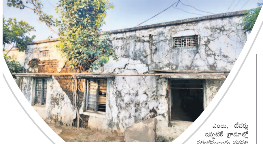
శిథిలావస్థలో ఉన్న పాఠశాల భవనం గోడలో పెరిగిన చెట్టు

మారడంతో పనులు జరగలేదు. ప్రస్తుతం అమ్మ ఆదర్శ పాఠశాలకు ఎంపికైంది. అయితే ప్రస్తుతం వర్షాకాలం ప్రారంభం కావడంతో ముప్పు పొంది ఉన్నది. నేటి నుంచి పాఠశాలల పునఃప్రారంభంకానున్న నేపథ్యంలో ఎప్పుడు ఏ ప్రమాదం జరుగుతుందోనని విద్యార్థులు, వారి తల్లిదండ్రులు భయాందోళన వ్యక్తం చేస్తున్నారు.