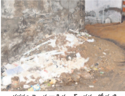
వనపర్తి తెలుగువాడి స్కూల్ ఆవరణలో మట్టి

2024-25 విద్యా సంవత్సరం బుధవారం నుంచి ప్రారంభమవుతున్నది. వేసవి సెలవులు ముగిశాక పాఠశాలలు తెరుచుకోవాలని ఉద్దేశించారు. దీంతో తల్లిదండ్రులు తమ పిల్లలను బడులకు పంపించేందుకు సిద్ధమయ్యారు. కాగా ప్రభుత్వ పాఠశాలల్లో పాఠ్యపుస్తకాలు, నోట్ బుక్కులు, రెండు జతల యూనిఫాంలను ఉచితంగా అందించనున్నారు. ఈ క్రమంలో ఈ ఏడాది స్కూల్స్ విద్యార్థులకు సమన్వయంతో స్కాగతం పలుకుతున్నాయి. ఇందుకు ప్రధానంగా ఉపాధ్యాయులు బదిలీలు, పదోన్నతుల కారణం. ఇప్పటివరకు ఈ ప్రక్రియ పెండింగ్లో ఉండగా పాఠశాలలు తెరిచే వారం ముందే ప్రారంభం కావడం ఇబ్బందిగా మారింది. ప్రభుత్వ బడుల్లో రోజుకు 90 శాతం హాజరు ఉండేలా విద్యార్థుల విధానం వర్ధిల్లడానికీ తీసుకున్నది. ఈ క్రమంలో బీహార్