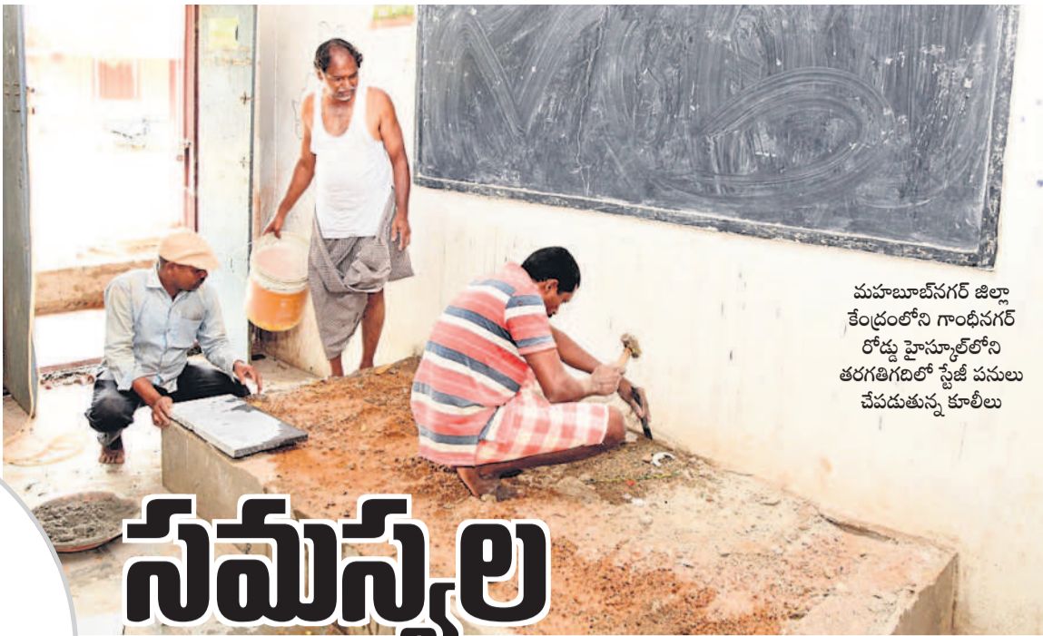
మహబూబ్ నగర్ జిల్లా కేంద్రంలోని గాంధీనగర్ రోడ్డు హైస్కూల్ లోని తరగతిగదిలో స్ట్రాక్చరు పనులు చేపడుతున్న కూలీలు