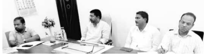
మాట్లాడుతూనే ముస్లింలతో కలెక్షన్ల కోసం ప్రేమకాండ