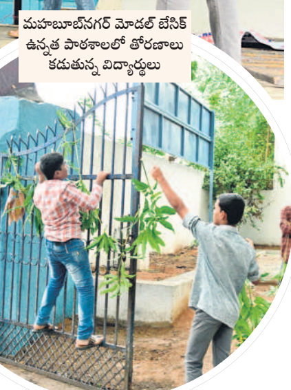
మహబూబ్ నగర్ మోడల్ బేసిక్ ఉన్నత పాఠశాలలో తోరణాలు కడుతున్న విద్యార్థులు