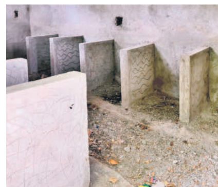
వెన్సిపాడు పాఠశాలలో అసంపూర్ణంగా టూయిలెట్ల పనులు, వర్షపునీరు నిలవడంతో బురదమయంగా మాలన మానవపాడు పాఠశాల ఆవరణ

మానవపాడు, జూన్ 12 : మండలంలోని 26 పాఠశాలలకు 4 పాఠశాలలు మినహా ఏ ఒక్క బడిలో కూడా విద్యార్థులు హాజరై కాలేదు. మండల కేంద్రంలోని జిల్లా పరిషత్ ఉన్నత పాఠశాలలో కనీసం ఒక్క విద్యార్థి హాజరై కాలేదంటే ఉపాధ్యాయులు పనితీరు ఏ విధంగా ఉందో అర్థం చేసుకో