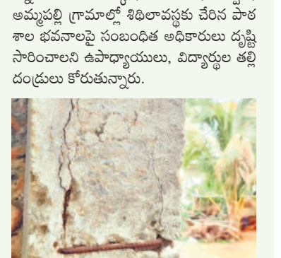
శిథిలావస్థకు చేరిన మాగనూర్ ప్రాథమిక పాఠశాలలో పిల్లలు

మాగనూరు, జూన్ 12 : ప్రభుత్వం ఏటా పాఠశాల భవనాల మరమ్మత్తుకు నిడు విడుదల చేస్తోంది. కానీ సంబంధిత అధికారుల అలసత్వం కారణంగా ప్రభుత్వ ఆశయానికి గండి పడుతున్నది. మండలకేంద్రంలోని ప్రాథమిక పాఠశాలను 2011లో నిర్మించిన అసంపూర్ణంగా పదిలేశారు. దీంతో ఆ భవనం ప్రస్తుతం శిథిలావస్థకు చేరుకోస్తోంది. పాత గ్రంథాలయం పూర్తి స్థాయిలో శిథిలావస్థకు చేరుకొని పెమ్మలూడుతున్నాయి.. భారీ వర్షాలు కురిస్తే ఏ క్షణమైనా కూలే అవకాశం ఉన్నదని గ్రామస్థులు వాపోతున్నారు. అలాగే చర్నూర్, మాగనూర్, వడ్యాడ్, అమ్మపల్లి గ్రామాల్లో శిథిలావస్థకు చేరిన పాఠశాల భవనాలపై సంబంధిత అధికారులు దృష్టి సారించాలని ఉపాధ్యాయులు, విద్యార్థుల తల్లిదండ్రులు కోరుతున్నారు.