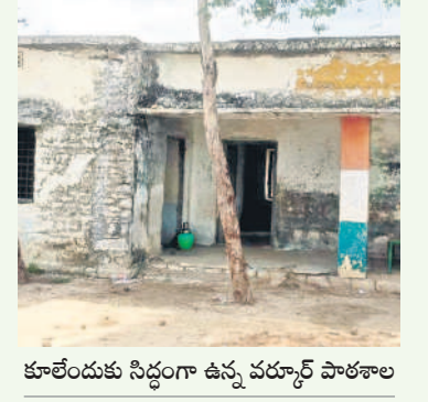
కూలేందుకు సిద్ధంగా ఉన్న చర్నూర్ పాఠశాల

మాగనూరు, జూన్ 12 : ప్రభుత్వం ఏటా పాఠశాల భవనాల మరమ్మత్తుకు నిడు విడుదల చేస్తోంది. కానీ సంబంధిత అధికారుల అలసత్వం కారణంగా ప్రభుత్వ ఆశయానికి గండి పడుతున్నది. మండలకేంద్రంలోని ప్రాథమిక పాఠశాలను 2011లో నిర్మించిన అసంపూర్ణంగా పదిలేశారు. దీంతో ఆ భవనం ప్రస్తుతం శిథిలావస్థకు చేరుకోస్తోంది. పాత గ్రంథాలయం పూర్తి స్థాయిలో శిథిలావస్థకు చేరుకొని పెమ్మలూడుతున్నాయి.. భారీ వర్షాలు కురిస్తే ఏ క్షణమైనా కూలే అవకాశం ఉన్నదని గ్రామస్థులు వాపోతున్నారు. అలాగే చర్నూర్, మాగనూర్, వడ్యాడ్, అమ్మపల్లి గ్రామాల్లో శిథిలావస్థకు చేరిన పాఠశాల భవనాలపై సంబంధిత అధికారులు దృష్టి సారించాలని ఉపాధ్యాయులు, విద్యార్థుల తల్లిదండ్రులు కోరుతున్నారు.