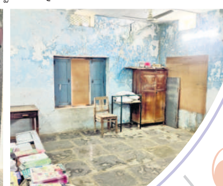
పచ్చు బడిడు పిల్లలను బడిడు చేర్చించేందుకు ఈ నెల 8 నుంచి బడిబాట ప్రారంభించిన ఉపాధ్యాయులు మొదటి రోజు తిరిగి ఆ తర్వాత కనిపించకుండా పోయారు. మొదటి రోజు ఒక్క జిల్లాపూరం ఉన్నత పాఠశాల మినహా ఏ ఒక్క పాఠశాలలోనూ అల్పాహారం, మధ్యాహ్నం భోజనం విద్యార్థులకు వందించలేదు. అలాగే చాలా పాఠశాలలో మరమ్మత్తు పనులు పెండింగ్లో ఉండడంతో తొలిరోజే ఉపాధ్యాయులు, విద్యార్థులు ఇబ్బందులు ఎదుర్కొన్నారు.