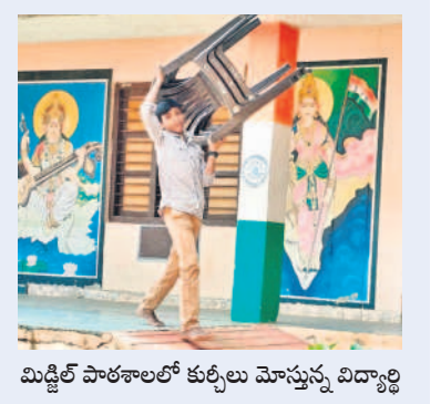
మిడ్చిల్ పాఠశాలలో కుర్చీలు మోస్తున్న విద్యార్థి

మిడ్చిల్, జూన్ 12 : పాఠశాలలు ప్రారంభమైన తొలిరోజు విద్యార్థులు అంతం మాత్రంగానే హాజరయ్యారు. గత ప్రభుత్వం నిర్వహించిన మన ఊరు-మన బడి కార్యక్రమాన్ని నేటి కాంగ్రెస్ సర్కారు అమ్మ ఆదర్శ పాఠశాలలుగా పేరు మార్చి నిడులు మంజూరు చేసింది. తరగతి గదులకు రంగులు వేయడం, మరుగుదొడ్ల మరమ్మత్తులు, తాగునీటి సౌకర్యం, ప్యాన్లు, లైట్లు వంటి మరమ్మత్తులు పూర్తి చేయాలని విద్యాశాఖ ఆదేశించినా మండలంలోని పలు పాఠశాలల్లో పనులు పూర్తి కాలేదు. మండల కేంద్రంలోని హైస్కూల్ లోక ఇద్దరు, ముగ్గురు విద్యార్థులే వచ్చారు. పచ్చిన వారితోనే ఉపాధ్యాయులు కుర్చీలు మోయింది తరగతి గదులకు మామిడి తోరణాలు కట్టించారు. అయితే ఏ పాఠశాలలోనూ విద్యార్థులకు అల్పాహారం అందించలేదు.