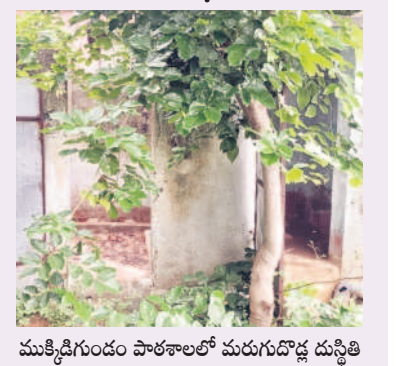
ముక్తిగిరి మండల పాఠశాలలో మరుగుదొడ్ల దుస్థితి

కొల్హాపూర్, జూన్ 12 : విద్యాసంవత్సరం ప్రారంభం విద్యార్థులకు సమస్యలు సాగతం పలికాయి. యూనిఫామ్స్, పాఠ్యపుస్తకాల సంగతి పక్క పెడితే మొదటి రోజే ప్రభుత్వ పాఠశాలల్లో భయభయంగా చదువులు ప్రారంభమయ్యాయి. పని చెప్పవచ్చు. మంత్రి ప్రాతినిధ్యం వహించే కొల్హాపూర్ నియోజకవర్గంలో ప్రభుత్వ పాఠశాలలు చాలా వరకు శిథిలావస్థకు చేరుకున్నాయి. మండల పరిధిలోని నార్సాపూర్ ప్రభుత్వ పాఠశాల శిథిలావస్థకు చేరింది. కానీ ఇందులోనే నూతన విద్యాసంవత్సరం క్లాసులు ప్రారంభమయ్యాయి. పరుసగా కుర్చీలు వచ్చాలి దానికి విద్యార్థులే కాదు పాఠశాలలో విద్యా బోధన చేసే ఉపాధ్యాయులు కూడా ప్రాణాలను అరచేతిలో పెట్టుకున్నారు. ముక్తిగిరి మండల ప్రభుత్వ పాఠశాలలో 8వ తరగతి వరకు క్లాసులు ఉన్నాయి. 160 మంది విద్యార్థులు ఉన్నారు. ఇందులో 70 మందికి పైగా విద్యార్థులు ఉన్నా ఒక్క మాత్రం కూడా లేకపోవడంతో డ్రా పౌన్ట్ పెరుగుతున్నాయి.