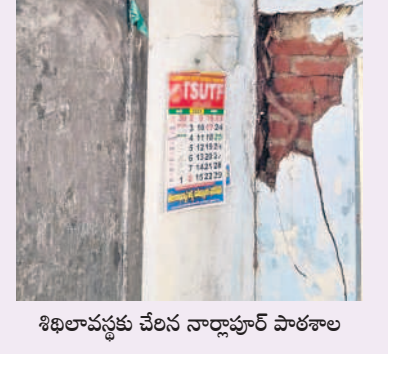
శిథిలావస్థకు చేరిన నార్సాపూర్ పాఠశాల

కొల్హాపూర్, జూన్ 12 : విద్యాసంవత్సరం ప్రారంభం విద్యార్థులకు సమస్యలు సాగతం పలికాయి. యూనిఫామ్స్, పాఠ్యపుస్తకాల సంగతి పక్క పెడితే మొదటి రోజే ప్రభుత్వ పాఠశాలల్లో భయభయంగా చదువులు ప్రారంభమయ్యాయి. పని చెప్పవచ్చు. మంత్రి ప్రాతినిధ్యం వహించే కొల్హాపూర్ నియోజకవర్గంలో ప్రభుత్వ పాఠశాలలు చాలా వరకు శిథిలావస్థకు చేరుకున్నాయి. మండల పరిధిలోని నార్సాపూర్ ప్రభుత్వ పాఠశాల శిథిలావస్థకు చేరింది. కానీ ఇందులోనే నూతన విద్యాసంవత్సరం క్లాసులు ప్రారంభమయ్యాయి. పరుసగా కుర్చీలు వచ్చాలి దానికి విద్యార్థులే కాదు పాఠశాలలో విద్యా బోధన చేసే ఉపాధ్యాయులు కూడా ప్రాణాలను అరచేతిలో పెట్టుకున్నారు. ముక్తిగిరి మండల ప్రభుత్వ పాఠశాలలో 8వ తరగతి వరకు క్లాసులు ఉన్నాయి. 160 మంది విద్యార్థులు ఉన్నారు. ఇందులో 70 మందికి పైగా విద్యార్థులు ఉన్నా ఒక్క మాత్రం కూడా లేకపోవడంతో డ్రా పౌన్ట్ పెరుగుతున్నాయి.