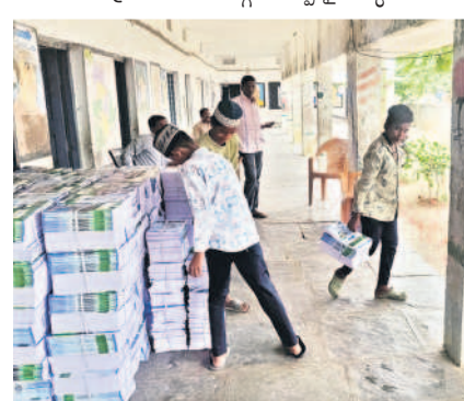
ఎర్రసత్వం సూట్ స్టాక్ పాయింట్ వద్ద పాఠ్యపుస్తకాలను ఆటోలోకి ఎక్కిస్తున్న విద్యార్థులు, గాంధీ చౌరస్తా పాఠశాలలో శిథిలావస్థలో ఉన్న తరగతిగది

జడ్పర్ టౌన్, జూన్ 12 : పాఠశాల పునః ప్రాంభంలోనే విద్యా శాఖాధికారుల అలసత్వం స్పష్టంగా కనిపించింది. పాఠశాలలు ప్రాంభం య్యేనాటికి పాఠ్యపుస్తకాలు, యూనిఫాం చేరాలని ప్రభుత్వం ఆదేశించినా సంబంధిత అధికారులు పట్టించుకోలేదు. జడ్పర్ మున్సిపాలిటీ పరిధిలో దాదాపు మూడువేలకు పైగా యూనిఫాంలు అవసరం ఉండగా, కేవలం పదిహేను వందల డున్నటు మాత్రమే ఇవ్వడం గమనార్హం. మండలంలో 89 ప్రభుత్వ పాఠశాలలు ఉండగా, పలు పాఠశాలలు అరకొర వనపర్తిలోనే ప్రాంభమయ్యాయి. అవినీతి, స్వేచ్ఛ లేక విద్యార్థులతోనే పాఠశాలలను శుభ్రం చేయించారు. ఎర్రసత్వం, గాంధీ చౌరస్తా ప్రైవేట్ స్కూల్లో టీచర్లు, విద్యార్థులు కలిసి తరగతి గదులను శుభ్రం చేశారు. కోడల్ జెడ్పీ హైస్కూల్లో అల్పాహారానికి బ్రేక్ వడింది.