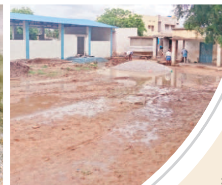
పచ్చు బడిడు పిల్లలను బడిడు చేర్చించేందుకు ఈ నెల 8 నుంచి బడిబాట ప్రారంభించిన ఉపాధ్యాయులు మొదటి రోజు తిరిగి ఆ తర్వాత కనిపించకుండా పోయారు. మొదటి రోజు ఒక్క జిల్లాపూరం ఉన్నత పాఠశాల మినహా ఏ ఒక్క పాఠశాలలోనూ అల్పాహారం, మధ్యాహ్నం భోజనం విద్యార్థులకు వందించలేదు. అలాగే చాలా పాఠశాలలో మరమ్మత్తు పనులు పెండింగ్లో ఉండడంతో తొలిరోజే ఉపాధ్యాయులు, విద్యార్థులు ఇబ్బందులు ఎదుర్కొన్నారు.