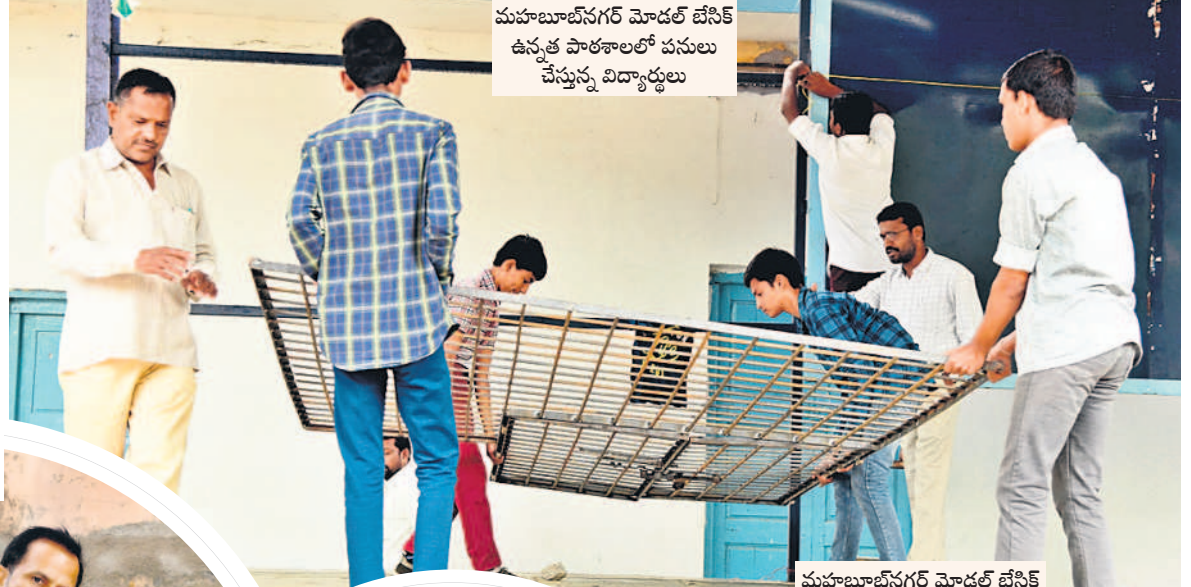
మహబూబ్ నగర్ మోడల్ బేసిక్ ఉన్నత పాఠశాలలో పనులు చేస్తున్న విద్యార్థులు