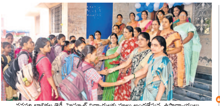
వనపర్తి బాలికల జెడ్పీ హైస్కూల్లో విద్యార్థులకు పూలు అందజేస్తున్న ఉపాధ్యాయులు

లోని ఉన్నత పాఠశాల విద్యార్థులకు ఎంపీపీ ధ గ్రామాల ప్రభుత్వ పాఠశాలలు బుధవారం సమస్యలతో సాగతం పలికాయి. పల్లెగడ్డ పాఠశాలలో అమ్మ ఆదర్శ పనులు నేటికీ పూర్తి కాలేదు. కామారం పాఠశాలలో ఇద్దరు విద్యార్థులు హాజరై కాగా వారితోనే ఉపాధ్యాయులు శుభ్రం చేయిస్తున్న దృశ్యాలు కనిపించాయి. నవాబ్ పేట