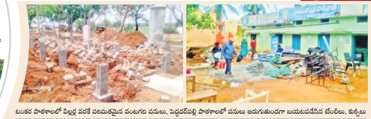
టంకర్ పాఠశాలలో పిల్లల వరకే పరిమితమైన వంటగది పనులు, పెద్దపర్తిపల్లి పాఠశాలలో పనులు జరుగుతుండగా బయటపడిన బేంచీలు, కుర్చీలు