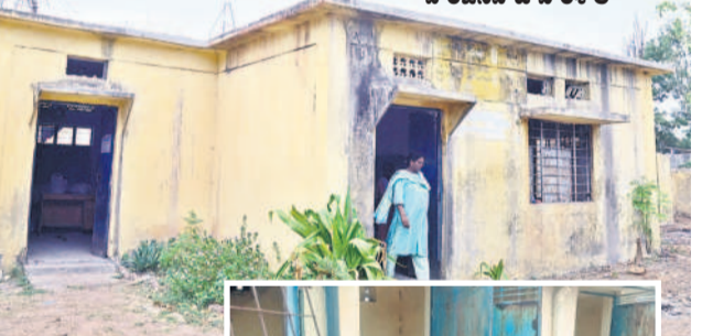
విద్యార్థులు హాజరుకాని హరిజనవాడ పాఠశాల

పాఠశాలల పున:ప్రారంభం విషయం తెలిసినా అధికారులు, ఉపాధ్యాయులు నిర్లక్ష్యంతో కొన్ని పాఠశాలలు చెక్కినవిధారితో దర్జాను చేయాల్సి ఉన్నా.. పట్టించుకోని తనంతో అప్రవృత్తంగా మారాయి. కొన్ని పాఠశాలల్లో మరమ్మత్తు పనులు కొనసాగుతుండడంతో పాఠశాల ఆవరణ, తరగతి గదులు విద్యార్థులు కూర్చుండేందుకు వీలు లేకుండా తయారయ్యాయి. మరిన్ని చోట్ల మరుగుదొడ్లు, తాగునీటి సమస్యలు నెలకొన్నాయి.