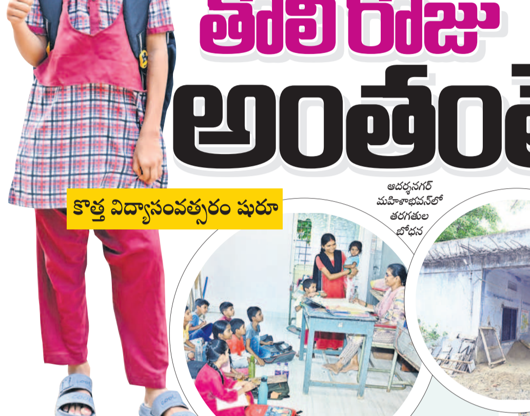
కొత్త విద్యాసంవత్సరం పురూ