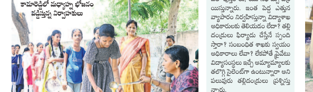
కామారెడ్డిలో మధ్యాహ్న భోజనం వడ్డిస్తున్న నిర్వాహకులు

ప్రైవేటు పాఠశాలల్లో విద్యా వ్యాపారం సక్సెస్ ఫుల్ గా కొనసాగుతున్నది. పుస్తకాలు, యూనిఫామ్స్, నోట్ బుక్స్, ట్రీ, బెల్ట్, స్టాప్స్ డ్రైన్ తదితర వాటి వేరేవి వ్యాపారం నిర్వహిస్తున్నారు. పుస్తకాలు కొనుగోలు చేయని తల్లిదండ్రుల పోస్తూ పాఠశాలల నుంచి మెన్సేజీలు వస్తున్నాయి. ఇదంతా తెలిసినా విద్యాశాఖ అధికారులు మాత్రం నిమ్మకు నీరెత్తినట్లు వ్యవహరిస్తుండడం గమనార్వం. కొన్ని పాఠశాలలు ఎవరికీ వచ్చుకుండా వ్యాపారం కొనసాగిస్తున్నాయి. పాఠశాలకు సమీపంలోనే ఓ దుకాణం ఏర్పాటు చేసి అందులో సిబ్బందితో పుస్తకాలు, యూనిఫామ్స్ విక్రయిస్తున్నారు. ఇంత పెద్ద ఎత్తున వ్యాపారం నిర్వహిస్తున్నా విద్యాశాఖ అధికారులకు తెలియడం లేదా? తల్లిదండ్రులు ఫిర్యాదు చేస్తేనే స్పందిస్తారా? సబబంత శాఖకు స్వయం ఉపాధ్యాయులు లేదా? లేకపోతే ప్రైవేటు విద్యాసంస్థలు ఇచ్చే అమ్మామ్మలకు తల్లిగొన్ని నైలెట్లగా ఉంటున్నారా అని పలువురు తల్లిదండ్రులు ప్రశ్నిస్తున్నారు.