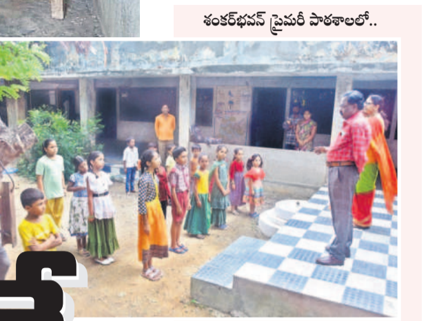
శంకర్ బస్ స్టేషన్ సైబరీ పాఠశాలలో..

తక్కువ సంఖ్యలో విద్యార్థులు నిజామాబాద్ నగరంలోని పలు పాఠశాలల్లో విద్యార్థులు తక్కువ సంఖ్యలో హాజరయ్యారు. అంబేద్కర్ కాలనీలోని హరిజనాచార ప్రభుత్వ పాఠశాలకు విద్యార్థులు రాలేదు. హమాల్ నగర్ పాఠశాలలో కేవలం ఐదుగురు మాత్రమే హాజరయ్యారు. రాజీవ్ నగర్ కాలనీలోని పాఠశాలకు 20 మంది విద్యార్థులు వచ్చారు. ఆదర్శనగర్ పాఠశాలలో అమ్మ ఆదర్శ పనులు పూర్తికాకపోవడంతో విద్యార్థులను మహిళా భవన్లో ఉంచి బోధిస్తున్నారు. పోలీస్ లైన్ పాఠశాలలో పనులు అసంపూర్ణంగా ఉండడంతో ఉదయం ప్రైవేట్, మధ్యాహ్నం హైస్కూలును నిర్వహించారు.