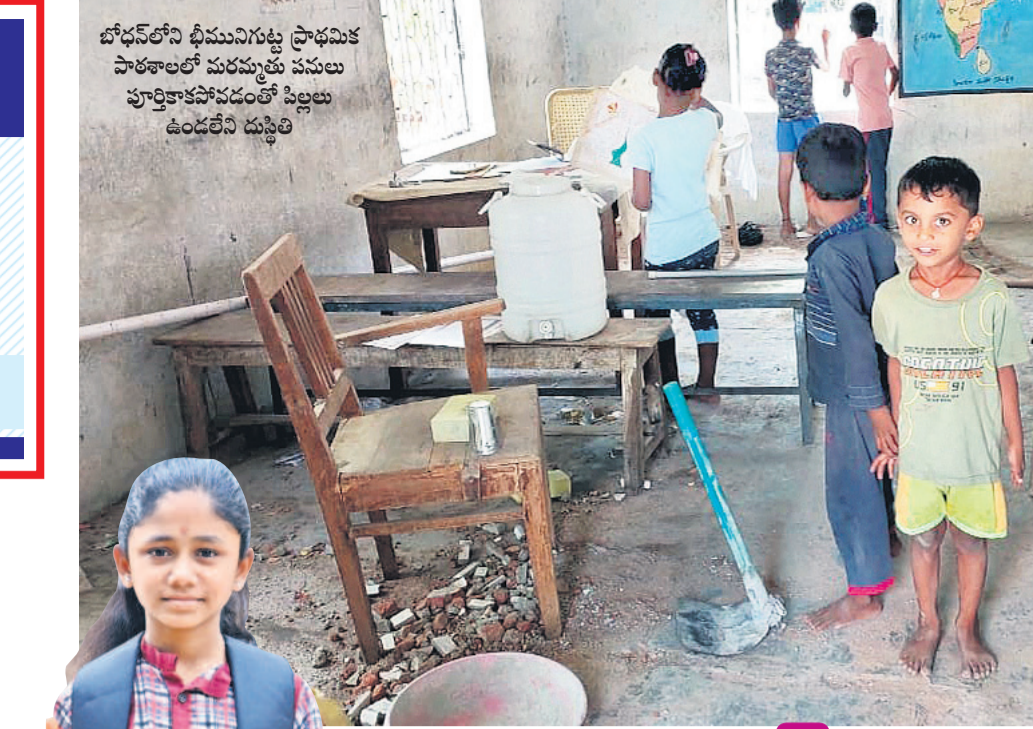
బోధన్లోని భీమునిగుట్ట ప్రాథమిక పాఠశాలలో సురమ్యుతు పనులు పూర్తికాకపోవడంతో పిల్లలు ఉండలేని దుస్థితి