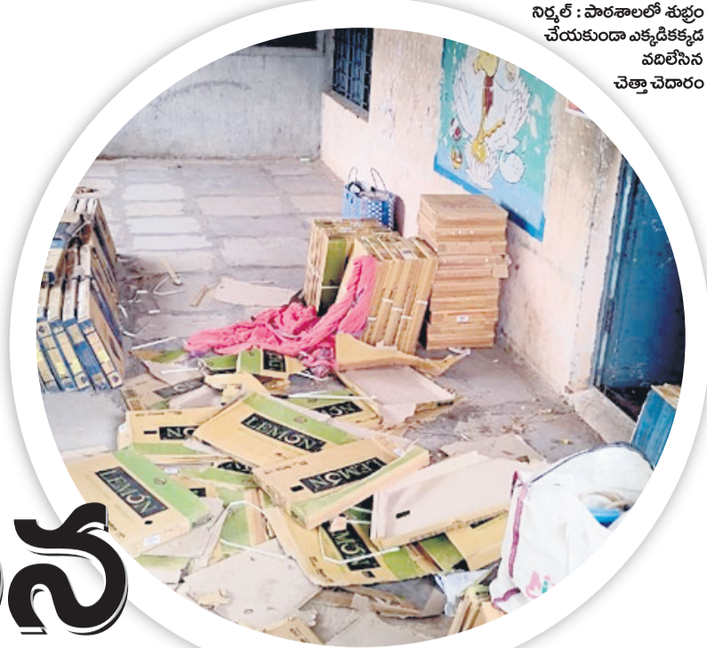
నిర్మల్ : పాఠశాలలో కుళ్లం చేయకుండా ఎక్కడిక్కడ వదిలిన చెత్తా చెదారం