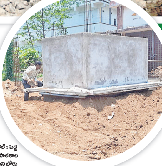
నర్సాపూర్ (జి) ఉన్నత పాఠశాలలో కొనసాగుతున్న తాగునీటి ల్యాంకు వసూలు..