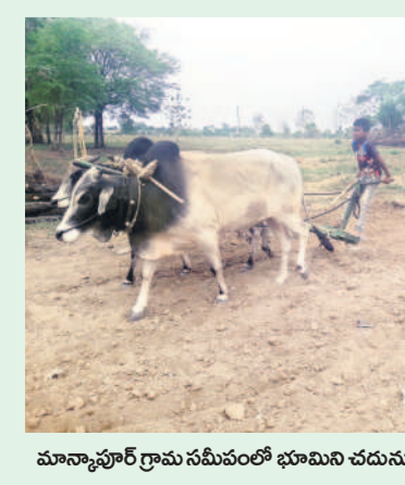
మాన్యూషూర్ గ్రామ సమీపంలో భూమిని చదును చేస్తున్న బాలురు

ఇదేనా బడిబాట నార్సూర్, జూన్ 12 : ప్రభుత్వ పాఠశాలల్లో పిల్లల సంఖ్యను పెంచాలని ప్రభుత్వం బడిబాట కార్యక్రమాన్ని అభివృద్ధి చేయాలిగా ప్రారంభించింది. నార్సూర్, గాదిగూడ మండలాల్లోని మారుమూల గ్రామాల్లో బడిబాట కార్యక్రమం మొక్కుబడిగా సాగుతోంది. బుధవారం పాఠశాలలు పునఃప్రారంభం అయినప్పటికీ పిల్లలు పాఠశాలకు వెళ్లకుండా తల్లిదండ్రులతో పాటు బాట పట్టారు. మాన్యూషూర్ గ్రామ సమీపంలో భూమిని చదును చేస్తుండగా 'నమస్తే తెలంగాణ' తన కెమెరాలో బంధించింది.