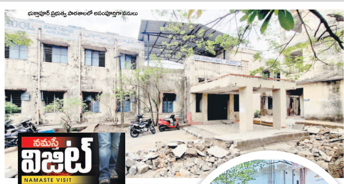
భుక్కాపూర్ ప్రభుత్వ పాఠశాలలో అసంపూర్ణంగా వసూలు