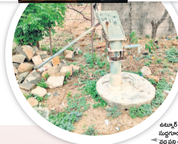
ఉట్నూర్ రూరల్ : పెద్ద సుద్దుగూడలో పాఠశాల వద్ద వనీ చేయని బోరు

అమ్మ ఆదర్శ పాఠశాల పథకం కింద చేపట్టిన పనులు చాలా చోట్ల పెండింగ్లోనే ఉన్నట్లు క్షేత్రస్థాయి పరిశీలనలో తెలిసింది. ఎక్కడికీ వెళ్లి చూడాలి అసంపూర్ణంగానే కనిపిస్తున్నాయి. 735 బడుల్లోని 608 పాఠశాలల్లో పనులు ప్రారంభించారు. వీటిలో ఇప్పటి వరకు దాదాపు 100 పాఠశాలల్లో మాత్రమే పనులు పూర్తిస్థాయిలో జరిగినట్లు తెలిసింది. మెజార్టీ పాఠశాలల్లో మరుగు దొడ్లు, కిచెన్ షెడ్లు, ప్రహారీ నిర్మాణం, ఫ్లోరింగ్, తాగునీటి వసతి పనులు పూర్తికాలేదన్న ఆరోపణలు ఉన్నాయి. కొన్ని చోట్ల పనులు చేసినప్పటికీ బిల్లులు కూడా చేతికి రావడం లేదని తెలుస్తున్నది. పనులు ప్రారంభమై మూడు నెలలు గడుస్తున్నా ఇంకా చాలా చోట్ల టాయిలెట్లు, ప్రహారీ పనులు ప్రారంభించకపోవడంతో ఈ సారి కూడా విద్యార్థులు ఆరు బయటనే అత్యవసరాలను తీర్చుకోవాల్సి పరిస్థితి ఏర్పడింది. అమ్మ ఆదర్శ పాఠశాల కార్యక్రమం అమలుతో మరొకటి ఇబ్బందులు ఎదురవుతున్నాయని స్థానికులు చెబుతున్నారు. క్షేత్ర స్థాయిలో అధికారుల పర్యవేక్షణ లేకపోవడంతో ఇలాంటి పరిస్థితికి దారి తీసేందన్న వాదనలున్నాయి.