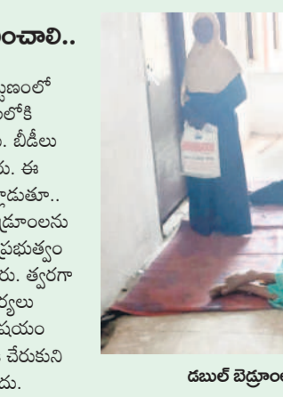
డబుల్ బెడ్రూంలలో నిలిచిన అబ్దులారులు

డబుల్ బెడ్రూంలను అందించాలి.. ఘోసా, జూన్ 12 : ఘోసా పట్టణంలో నిర్మించిన డబుల్ బెడ్రూంలలోకి లబ్ధిదారులు బుధవారం వెళ్లారు. డి.డి.లు చుట్టూకుంటూ అక్కడే ఉన్నారు. ఈ సందర్భంగా లబ్ధిదారులు మాట్లాడుతూ.. గత కేసీఆర్ ప్రభుత్వం డబుల్ బెడ్రూంలను నిర్మించింది, వాటిని కాంగ్రెస్ ప్రభుత్వం కేటాయించడం లేదని మండిపడ్డారు. త్వరగా అందించేలా అధికారులు చర్యలు తీసుకోవాలని కోరారు. ఈ విషయం తెలుసుకున్న పోలీసులు అక్కడికి చేరుకుని వారికి నచ్చజెప్పినా వినలేదు.