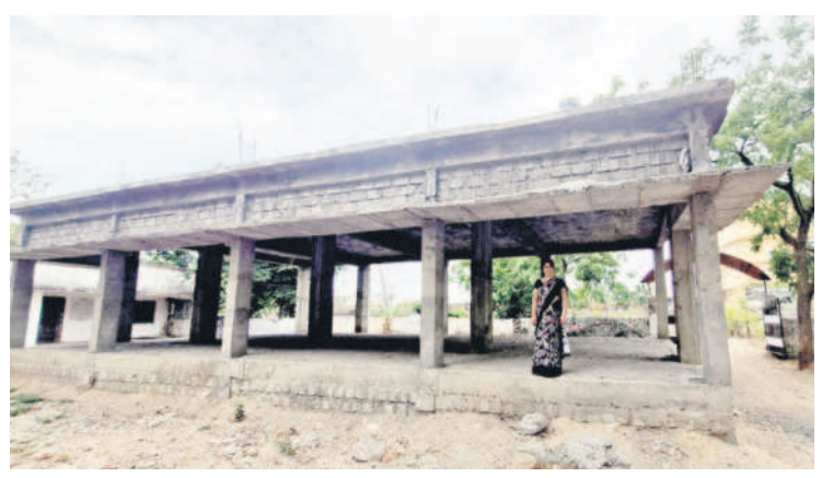
మావల పాఠశాలలో అసంపూర్ణంగా ఉన్న తరగతి గదుల నిర్మాణం