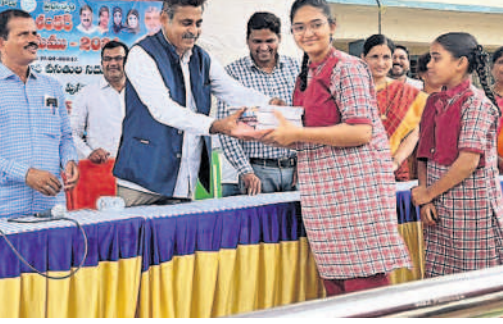
విద్యార్థులకు పాఠ్యపుస్తకాలను అందజేస్తున్న ఎంపీ కొండా విశ్వేశ్వరరెడ్డి