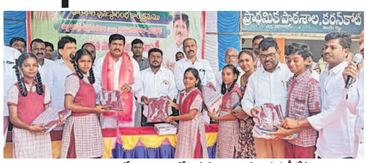
తాండూరు మండలంలో విద్భార్థులకు నోటుపుస్తుకాలు, దుస్తులు పంపిణీ చేస్తున్న ಎಮ್ಕ್ ಪ್ರೈ ಬುಯ್ಯನಿ ಮನಿ ಪಾರ್ ರಿಡ್ಡಿ

ప్రారంభించారు. ఈ కార్యక్రమంలో కాంగ్రెస్ పార్టీ మండల