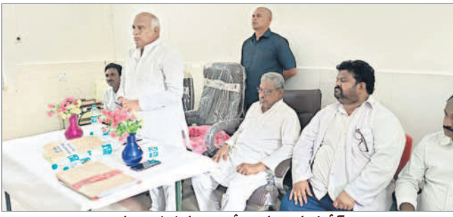
మాట్లాడుతున్న ఎమ్మెల్యే రామారావు పటేల్

ఎదురాపురం, జూన్ 13 : విద్యార్థులు ఆన్ లైన్లో దరఖాస్తు చేసుకొని బీసీ సంక్షేమ వసతి గృహాల్లో చేరాలని అదిలాబాద్ జిల్లా బీసీ అభివృద్ధి శాఖ అధికారి కే రాజలింగం సూచించారు. జిల్లా కేంద్రంలోని బీసీ కార్యాలయంలో గురువారం ఆయన విలేజరుల సమావేశంలో మాట్లాడారు. జిల్లాలోని 14 బాలబాలికల బీసీ వసతి గృహాల్లో నాణ్యత మైన విద్యుత్తులు, సుదీర్ఘమైన భోజనం, వసతి కల్పిస్తున్నట్లు తెలిపారు. యేటా సీట్లు కోసం పోటీ మరుగుతున్నట్లున్నారు. ఈ సందర్భంగా విద్యార్థులు https://bhostels.cgge.gov.in.index డి వెబ్ సైట్లో దరఖాస్తు చేసుకోవాలని సూచించారు. ప్రీమియం వసతి గృహంలో 360