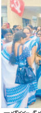
మహబూబ్ నగర్ కల్లెరేట్ ఎదురు ధర్మా చేస్తున్న ఆ శివర్లు, నాగరకర్మాల్ కల్లెరేట్ ఎదురు మాట్లాడుతున్న కార్యకర్తలు

అధీనకుని కొనసాగుతున్న ఇన్ ఫ్లో.. అయితే, జూన్ 13 : కర్ణాటకలోని అధీన అనకట్లకు ఇన్ ఫ్లో స్థూలంగా కొనసాగుతున్నది. ఎగువన కురుస్తున్న వర్షాలకు 5,455 క్యూసెక్కులు ఇన్ ఫ్లో ఉండగా, అప్పట్లో 5,455 క్యూసెక్కులు దిగువన ఉన్న సుంకేపేట బ్యారేజీకి చేరుతుందని అధీన ఏ అంబేద్కర్ తెలిపారు. ప్రస్తుతం ఆనకట్లలో 8.4 ఉండగా, అధీనకుని ఇన్ ఫ్లో అయిన పేర్లొచ్చాయి. తుంగభద్ర డ్యాండ్.. తుంగభద్ర డ్యాండ్ వరద కొనసాగుతున్నది. ఇన్ ఫ్లో 3,215 క్యూసెక్కులు ఉండగా, అప్పట్లో 10 క్యూసెక్కులు నమోదైంది. బీబీ డ్యాండ్ 100.85 గరిష్ట నీటి నిల్వ సామర్థ్యానికి గానూ ప్రస్తుతం 5.990 టీఎంసీల నీటి నిల్వ ఉన్నది. 1,688 అడుగుల పూర్తిస్థాయి నీటి మట్టానికి గానూ ప్రస్తుతం 1582.13 అడుగుల నీటిమట్టం ఉన్నట్లు బీబీ డ్యాండ్ నిజ్ అధికారి రామవేంకటేశ్వరరావు తెలిపారు.