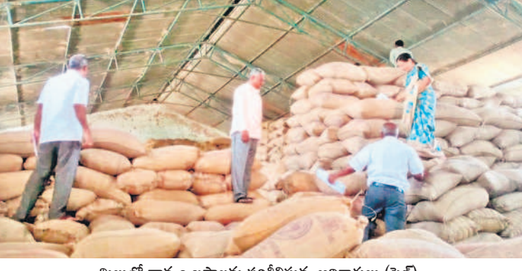
మిల్లల్లో ధాన్యం బస్తాలను పరిశీలిస్తున్న అధికారులు (ఫైల్)

గద్వాల, జూన్ 13 : ఏదైనా మిల్లుకు ధాన్యం కేటాయింపాలంటే ముందు కల్తెకత్తి అనుమతి తీసుకొని సివిల్ సప్లయ్ అధికారులు ఆయన ఆదేశానుసారంగా మిల్లుకు వచ్చి కేటాయింపాలి.. కానీ ఇక్కడ అలాంటి ఏ ఏ జరగవు.. గద్వాల జిల్లాలో ఆ నలుగురు ఏ ఏ జరగలే అదే వేదం బా వంటి అధికారులు పైనలే చేస్తారు.. ఇక్కడ అధికారుల పాత్ర నామమాత్రంగా ఉంటుంది.. ఆ నలుగురు ఇచ్చే మామూళ్లకు ఆపవేసి సివిల్ సప్లయ్ అధికారులు చిన్న కొత్త మిల్లుల యజమానుల పొట్టగొడుతున్నారు.. ఆ నలుగురి అండ చూసుకొని వారితోపాటు కొంత మంది మిల్లల యజమానులు 2022-2023 యాసంగికి సంబంధించి ప్రభుత్వం మిల్లులకు కేటాయించిన వరి ధాన్యం అమ్మకాన్ని ఎవరూ పట్టించుకోలేదు. జోగుళాంబ గద్వాల జిల్లాలో సుమారు రూ.10