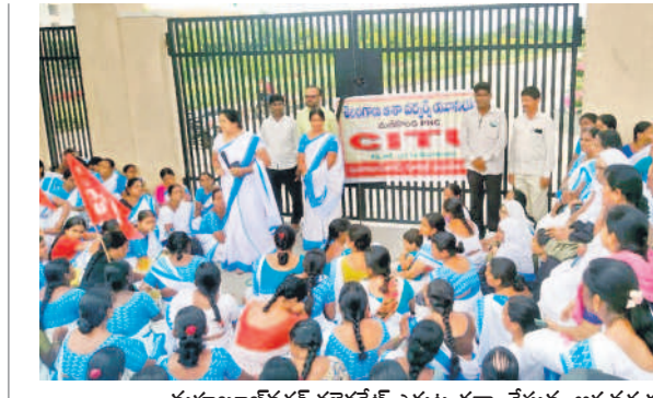
మహబూబ్ నగర్ కల్లెరేట్ ఎదురు ధర్మా చేస్తున్న ఆ శివర్లు, నాగరకర్మాల్ కల్లెరేట్ ఎదురు మాట్లాడుతున్న కార్యకర్తలు

ధర్మూరు, జూన్ 13 : ప్రయోగశాల జూరాల ప్రాజెక్టుకు వరద పెరుగుతున్నది. ఎగువన కురుస్తున్న వర్షాల ఆల్బుట్టి, నారాయణపూర్ ప్రాజెక్టుల నుంచి వరద చేరుతుండడంతో రోజురోజుకూ జూరాల నీటి మట్టం క్రమంగా పెరుగుతున్నది. ప్రాజెక్టు పూర్తి స్థాయి నీటి మట్టం 318.516 మీటర్లకు గానూ ప్రస్తుతం 317.020 వరకు ఉన్నట్లు అధికారులు తెలిపారు.