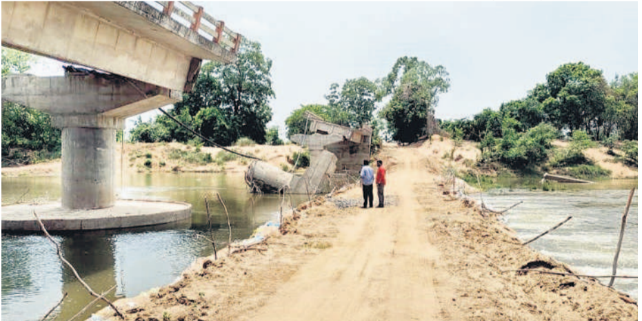
కూలిన బ్రిడ్జి పక్కనే మేడారం జాతర సమయంలో తాత్కాలికంగా నిర్మించిన రోడ్డు

ఏటూరునాగారం, జూన్ 13 : వానోస్తుండంటేనే ఆ రెండు గ్రామాల్లో ప్రజల్లో భయం మొదలవుతుంది. వరద భారీగా వస్తే రాకపోకలు నిలిచిపోవడమే గాక గతేడాది లాగే వరద గ్రామాన్ని ముంచెత్తితే తమ పరిస్థితి ఏంటో ఆందోళన వెంటాడుతున్నది. వివరాలిలా ఉన్నాయి. జంపన్నవారుపై ఏటూరునాగారం మండలం దొడ్ల సమీపంలో నిర్మించిన బ్రిడ్జి గతేడాది భూరిగా మునిగిపోవడంతో మల్యాల-కొండాయికు రవాణా స్తంభించింది. మేడారం జాతర సందర్భంగా ప్రైవేట్ వాహనాలను చిన్నబోయినప్పటి నుంచి ఊరట్టం వరకు మళ్లించేందుకు వారుపై తాత్కాలికంగా రూ. 20 లక్షలతో డైవర్స్ రోడ్డు పడిన మేడారం వాహనాలను గుర్తుచేసుకుంటున్నారు. అయితే ముంపు ప్రాంతాల్లోకి ముందుగానే అధికారులు రేపే, నిత్యావసర సరుకులను నిల్వ చేస్తుంటారు. కానీ ఇప్పటివరకు అధికారులు ఏ దిశగా చర్యలు తీసుకోకపోవడంతో పాటు తక్షణమే ప్రత్యామ్నాయ ఏర్పాట్లు చేయాలని గ్రామస్థులు కోరుతున్నారు. పుల్ ఓవర్ బ్రిడ్జికి ప్రతిపాదనలు కూలిన వంతెన మధ్య నుంచి తాత్కాలిక పుల్ ఓవర్ బ్రిడ్జి