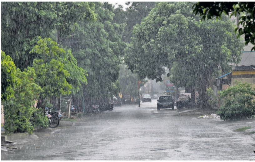
హనుమకొండలోని రెడ్డికాలనీలో కురుస్తున్న వర్షం