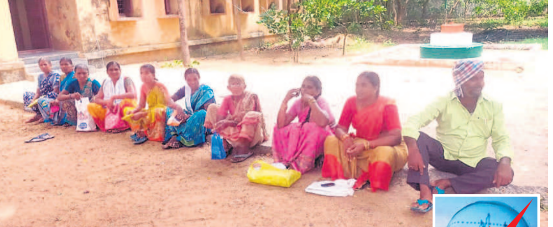
ఖానాపూరు మండల పరిషత్ కార్యాలయంలో బారులు తీరిన గృహజ్యోతి లబ్ధిదారులు

కోట్లతో వ్యాపార ఉదాయింపు..? బయ్యారం, జూన్ 13 : కోట్లలో అప్పులు చేసిన ఓ వ్యాపారి ఉదాయింపినట్లు మండల కేంద్రంలోని గాంధీసెంటర్ కు చెందిన కిరాణి వ్యాపారి తన సన్నిహితులు, స్నేహితుల నుంచి రూ. ఐదు కోట్ల అప్పులు చేసి ఆన్లైన్ గేమ్లో పోగొట్టుకున్నట్లు ప్రచారం జరుగుతున్నది. వారి నుంచి ఒక్కొక్క పెరగడంతో ఐదు రోజుల క్రితం దైవ దర్శనానికి వెళ్లినా సరే చెప్పి కుటుంబంతో సహా వెళ్లిపోయాడు. రోజులు గడుస్తున్నా ఫోన్లో అందుబాటులోకి రాకపోవడంతో అప్పు ఇచ్చిన వారు ఆందోళన చెందుతున్నారు. అప్పులు ఇచ్చిన కొందరు పోలీసులను ఆశ్రయించగా ఫిల్డీంగ్ వెళ్లాలని సూచించినట్లు సమాచారం.