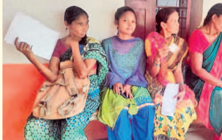
వాజేడు : ఎంపీడీవో కార్యాలయం వద్ద దరఖాస్తుల సవరణ కోసం వచ్చిన లబ్ధిదారులు

గృహజ్యోతి కోసం పడిగాపులు మొరాయిచిన ఆన్లైన్ నిర్దర్.. ఖానాపూరు/వాజేడు, జూన్ 13 : రాష్ట్ర ప్రభుత్వం ప్రతిష్టాత్మకంగా చేపట్టిన గృహజ్యోతి పథకం అమలుకు నోచుకోక అర్హతైన లబ్ధిదారులకు కష్టాలు తప్పడంలేదు. తెల్లరేపన కార్డుదారులకు 200 యూనిట్లలోపు ఉచిత విద్యుత్ అందించేందుకు ప్రజాపాలన గ్రామసభల్లో దరఖాస్తులను స్వీకరించింది. క్షేత్రస్థాయిలో విద్యుత్ సిబ్బంది సర్వే చేసి అర్హతను గుర్తించి ఉచిత బిల్లులు అందజేశారు. అయితే చాలా మంది దరఖాస్తుల్లో తప్పులుండడంతో వాటిని సరిదిద్దేందుకు ఎంపీడీవో కార్యాలయాల్లో ప్రత్యేక కౌంటర్లను ఏర్పాటు చేసింది. ఈ క్రమంలో పార్లమెంట్ ఎన్నికల