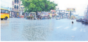
జనగామ పట్టణంలో పడుతున్న వాన