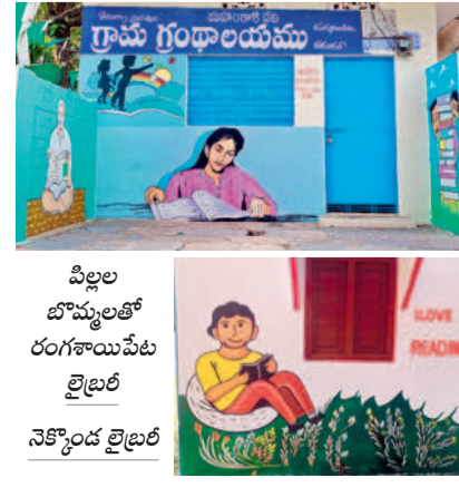
రంగాయపేట లైబ్రరీ గోడలపై వేసిన మోడల్ పిక్చర్లయల్ పెయింటింగ్