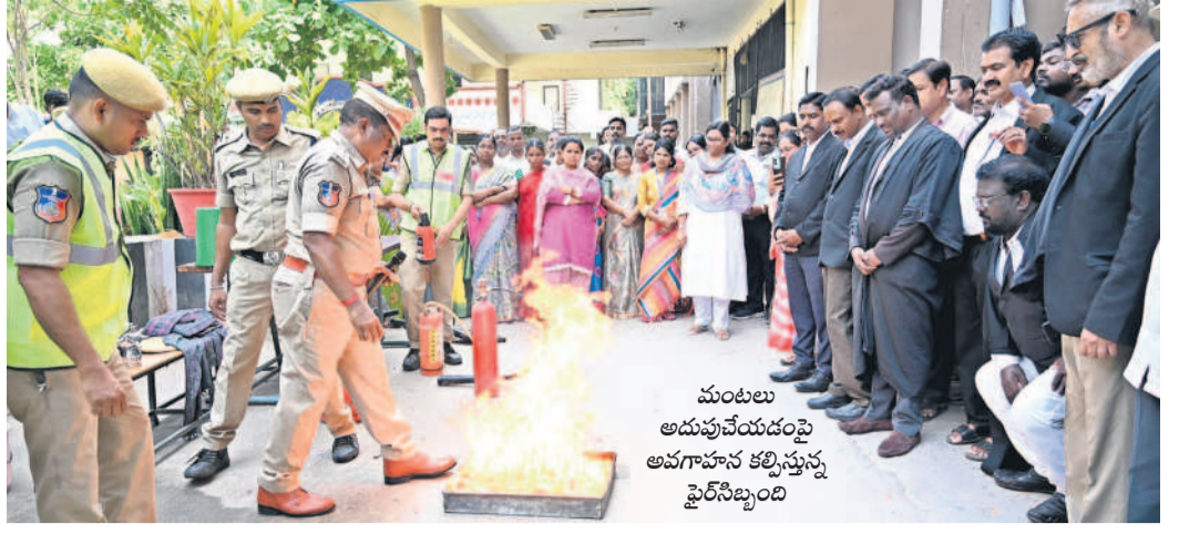
మంటలు అదుపుచేయడంపై అవగాహన కల్పిస్తున్న ఫైరింగ్ బృందం