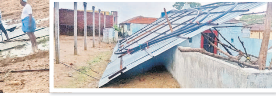
వెల్లుబ్బలో ఎగిరిపడిన వికలేశ్వరాల గుడి ధర్మశాల పైకప్పు రేకులు