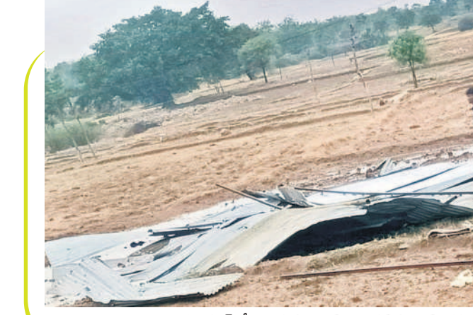
వెంకటాపూర్లో గాలిదుమారానికి ఎగిరిపడిన ఇంటిపైకప్పు రేకులు