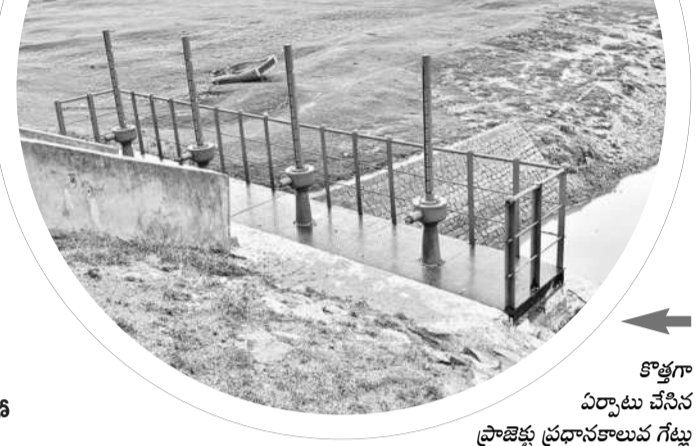
కొత్తగా ఏర్పాటు చేసిన ప్రాజెక్టు ప్రధానకాలువ గేట్లు

హాకీరాపు రక్షణ చర్యలు చేపట్టారు. అందులో భాగంగా ప్రాజెక్టు పర్యాటకుల రక్షణ కోసం మట్టా రేలింగ్, ప్రాజెక్టు ప్రధాన కాలువ గేట్లు వందలకొద్దీ తీసుకువెళ్లడానికి కావడంతో వాటి స్థానంలో కొత్తవి ఏర్పాటు చేసేందుకు రూ.34 లక్షలను మంజూరు చేశారు. ఆ నిధులతో పనులు ప్రారంభించిన అధికారులు ఇటీవల పనులు పూర్తి చేశారు. దీంతో స్థానికులు, పర్యాటకులు హార్దం వ్యక్తం చేస్తున్నారు. పండం కోసం ఒక్కరూపాయి వెచ్చించలేరు. అంతటి దీనస్థితిలో ఉన్న ప్రాజెక్టును సందర్శించిన కేసీఆర్ ప్రభుత్వంలోని అప్పటి మంత్రి తన్నీరు