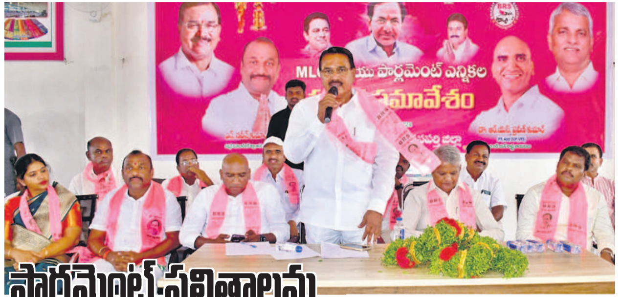
సమావేశంలో మాట్లాడుతున్న మాజీ మంత్రి నిరంజన్ రెడ్డి