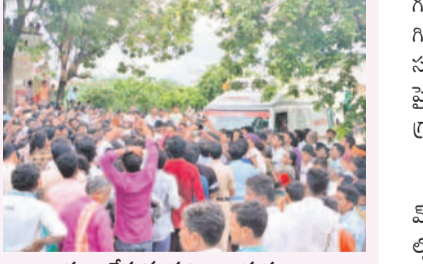
ధర్నా చేస్తున్న కుటుంబ సభ్యులు