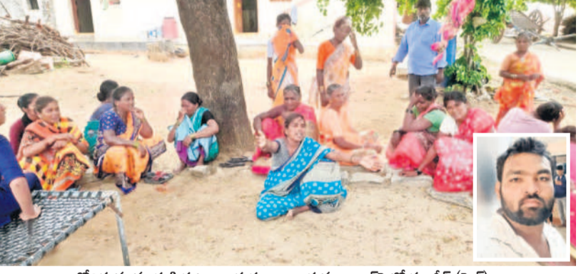
రోజున్ను మృతుడి కుటుంబ సభ్యులు బంధువులు, ఇన్సెల్ట్ సంచీ (వైల్)

ఊటూర్, జూన్ 14 : దాయాదుల మధ్య మొదలైన భూ తగాదాల్లో వ్యక్తి దారుణ హత్యకు గురైన ఘటన నారాయణపేట జిల్లా ఊటూర్ మండలం చిన్నపార్లలో చోటుచేసుకున్నది. పోలీసులు, స్థానికుల కడనం మేరకు.. దళిత కాలనీకి చెందిన గుప్పోల ఎక్కువకు ఇబ్బంది భార్యలు. మొదటి భార్య సంతానం అక్కరలేక మరొక భార్యను పెళ్లిచేసుకున్నారని ఆరోపణలు ఉన్నాయి. మొదటి భార్య సంతానం అక్కరలేక మరొక భార్యను పెళ్లిచేసుకున్నారని ఆరోపణలు ఉన్నాయి. మొదటి భార్య సంతానం అక్కరలేక మరొక భార్యను పెళ్లిచేసుకున్నారని ఆరోపణలు ఉన్నాయి. మొదటి భార్య సంతానం అక్కరలేక మరొక భార్యను పెళ్లిచేసుకున్నారని ఆరోపణలు ఉన్నాయి.