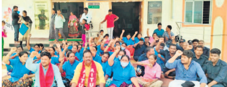
పనపర్తి ప్రభుత్వ జనరల్ దవాఖాన ఎదుట ధర్నా చేస్తున్న పారిశుధ్య కార్మికులు