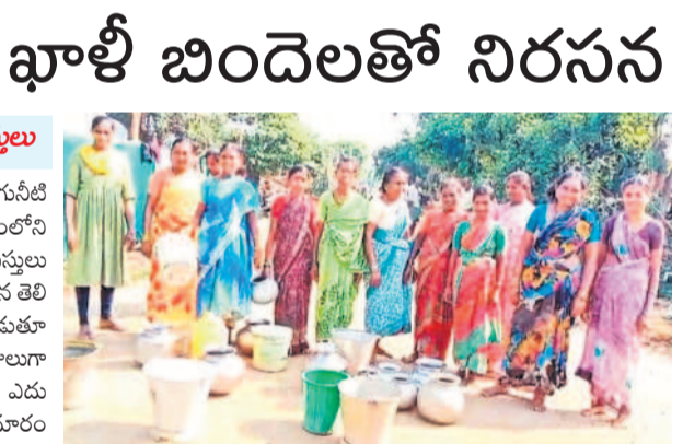
ఖాళీ బిందెలు, బిళ్లలతో నిరసన తెలుపుతున్న పందివంపుల గ్రామస్థులు

రోడ్డుకట్ట వదిలివేసి గ్రామస్థులు భూపాలపల్లి రూరల్, జూన్ 15 : తాగునీటి సమస్య తీవ్రమైన భూపాలపల్లి మండలంలోని సందిగామ శివారు పందివంపుల గ్రామస్థులు శనివారం ఖాళీ బిందెలు, బిళ్లలతో నిరసన తెలిపారు. ఈ సందర్భంగా వారు మాట్లాడుతూ సుమారు 40 కుటుంబాలకు వారం రోజులూ నీరు రావడం లేదని, తీవ్ర ఇబ్బందులు ఎదురవుతున్నాయని, రెండు కిలోమీటర్ల దూరంలోని కాంపల్లి నుంచి తిప్పకుంటున్నారని అన్నారు. పంచాయతీ కార్యదర్శి ఆధ్వర్యంలో మూడు బోర్డు వేసినప్పటికీ అందరికీ నీళ్లు అందడంలేదని, తమకు వెంటనే ప్రభుత్వం మంజూరిని సాకర్యం ఇప్పటి వరకు బోర్డులను సందంబించిన బిల్లులు కూడా రాలేదని తెలిపారు.