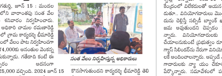
సంత వేలం నిర్వహిస్తున్న అధికారులు