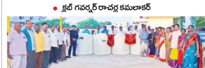
మంజీసీటీ ట్యాంకులు అందజేస్తున్న వానవీ, పనితా క్షేత్ర సభ్యులు