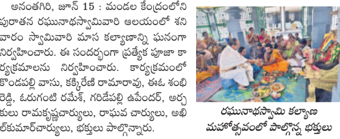
రఘునాథస్వామి కల్యాణ మహోత్సవంలో పాల్గొన్న భక్తులు