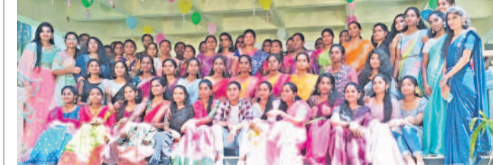
వీడియో సమావేశంలో కీట్స్ కళాశాల విద్యార్థులు