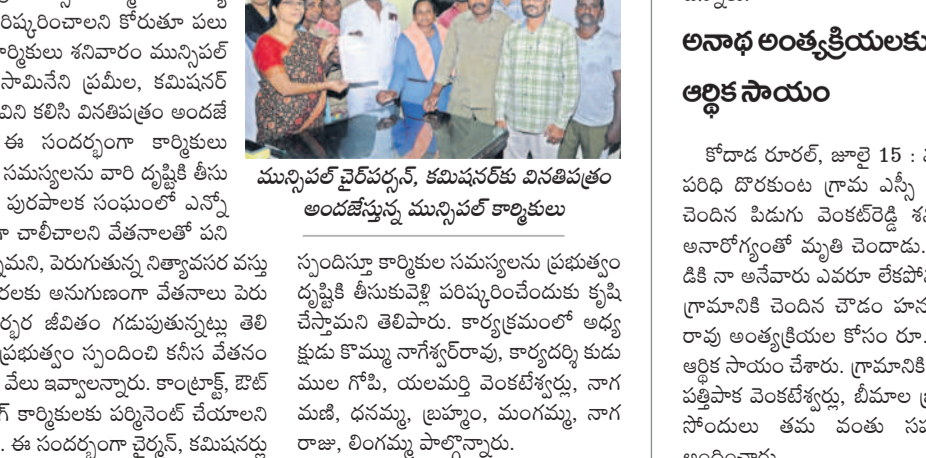
మున్సిపల్ కార్మికుల సమస్యలను పరిష్కరించాలని వినతిపత్రం అందజేస్తున్న మున్సిపల్ కార్మికులు