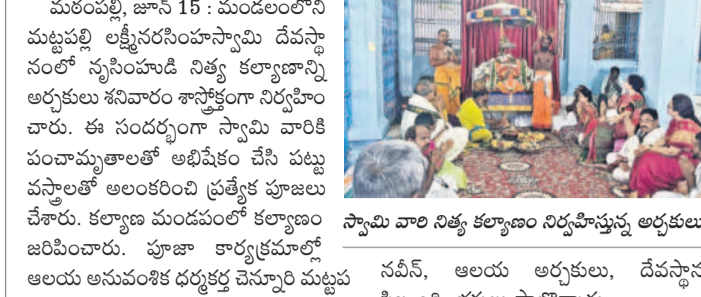
స్వామి వారి నిత్య కల్యాణం నిర్వహిస్తున్న అధికారులు