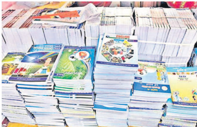
విద్యార్థులకు సరిపడా పుస్తకాలు రావాలి.

నేరేడుచర్ల, జూన్ 15 : ప్రభుత్వ పాఠశాలలోని పేద విద్యార్థులకు పట్ట సర్కారు నిర్ణయం ప్రకారం పుస్తకాల పునఃప్రారంభం తర్వాత విద్యార్థులకు పుస్తకాలు అందజేయాలి. గుండ్రం పూర్తి స్థాయిలో అందించలేదు. ఇప్పటి వరకు 70 శాతం మంది విద్యార్థులకు పుస్తకాలు అందుబాటులోకి రాగా 30 శాతం మంది విద్యార్థులు పాఠ్య పుస్తకాలు చేరలేదు. భూజాన్ సగర్ నియోజకవర్గ వ్యాప్తంగా మొత్తం 249 ప్రభుత్వ పాఠశాలలు ఉన్నాయి. వాటికి 94,959 పాఠ్య పుస్తకాలు అవసరం కాగా 62,426 మాత్రమే వచ్చాయి. ఇంకా 32,533 రావాల్సి ఉన్నవి.