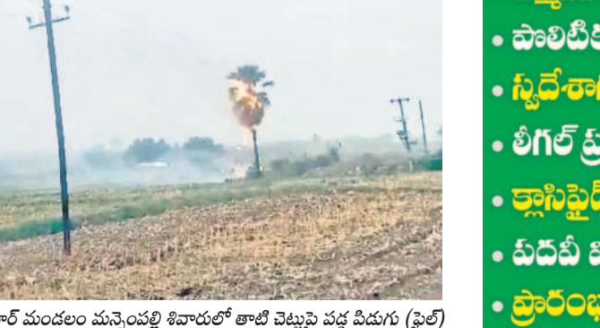
తిమ్మపూర్ మండలం మన్నెపల్లి శివారులో తాటి చెట్టుపై వర్ష పిడుగు (ఫైల్)

విద్యుత్ గృహోపకరణల ప్లగ్గ్ సిస్టమ్ బోర్డు నుంచి తీసివేయాలి. పిడుగులు తాటి చెట్లు, విద్యుత్ స్తంభాల మీద ఎక్కువగా పడుతుంటాయి. కాబట్టి వర్షం పడుతున్న సమయంలో విద్యుత్ తీగల కింద, ట్రాన్స్ ఫార్మర్ సమీపంలో ఉండకూడదు. ఒక్కోసారి పిడుగు వర్ష ప్రదేశంలోనే మరోసారి పడే అవకాశం ఉంటుంది. కాబట్టి ఆ ప్రాంతానికి వెళ్లకూడదు. వర్ష సూచన ఉన్నప్పుడు గొడుగులపై ఇసుక బోర్డులు, కెమెరాలు, సెల్ ఫోన్ల దగ్గర ఉంచుకోక పోవడం చాలా మంచిది. పశువులను గుడిసెలు, కొట్లాలు, పెద్దకో కట్టివేయాలి. చెట్ల కింద ఉంచొద్దు. గృహ కుటుంబం, మెరుపులతో వర్షం పడినప్పుడు రైతులు పొలాల వద్ద ఉండకూడదు.