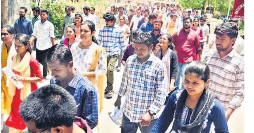
పరీక్ష రాసిన అనంతరం బయటకు వస్తున్న అభ్యర్థులు

హనుమకొండ, జూన్ 16 : సివిల్ ప్రెజిడెంట్ పరీక్ష ఆదివారం ప్రశాంతంగా ముగిసినట్లు హనుమకొండ కలెక్టరేట్ ప్రాజెక్టు తెలిపారు. మొత్తం 4,730 మంది అభ్యర్థులకు హనుమకొండలో 11 పరీక్షా కేంద్రాలు ఏర్పాటు చేయగా, ఉదయం 9:30 గంటల నుంచి జరిగిన పరీక్షకు 2,637 మంది (55.75 శాతం) హాజరు కాగా, మధ్యాహ్నం 2:30 గంటల నుంచి జరిగిన పరీక్షకు 2,614 మంది (55.26 శాతం) హాజరయ్యారు. యూపీఎస్సీ సెంట్రల్ అప్లైడ్ రిజల్ట్ హాల్ వరకు, ఎన్టీసీలలో సీనియర్ వరకు రెడ్డి యూనివర్సిటీ ఆఫ్ టెక్నాలజీ కళాశాల, శ్రీ