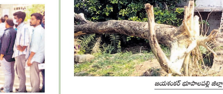
జయశంకర్ భూపాలపల్లి జిల్లాలోని మోరంపల్లి ఎత్తిపోతల ప్రాజెక్టు