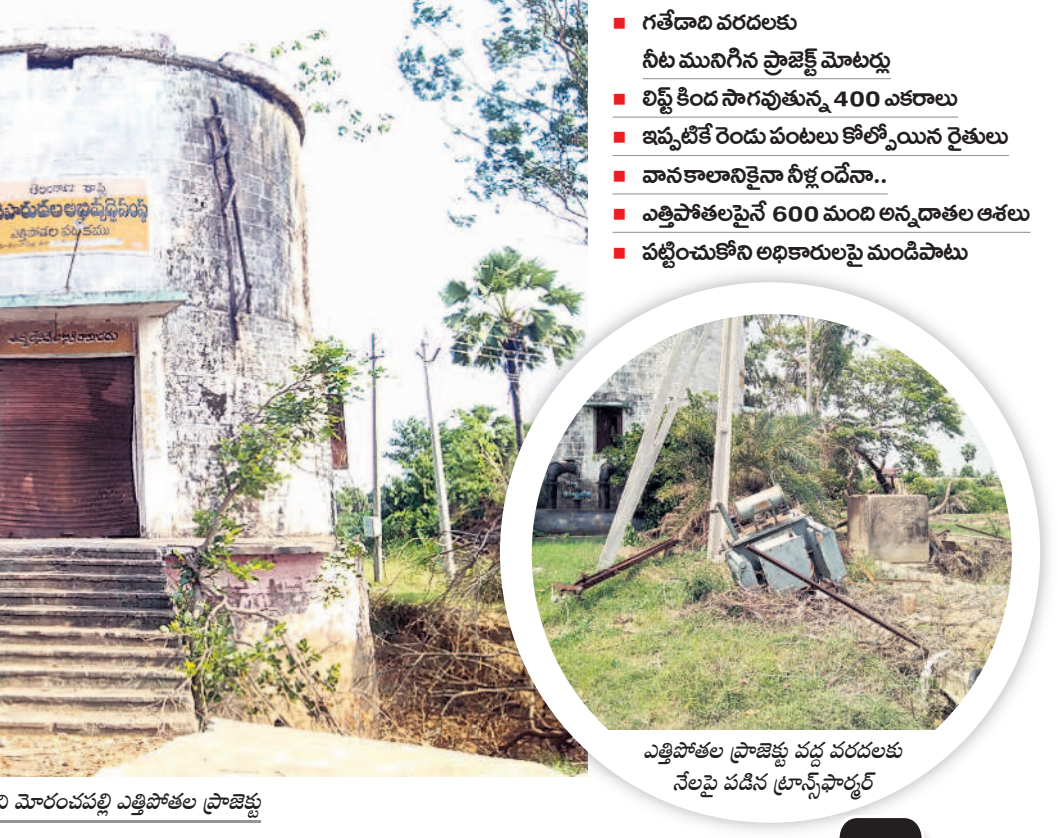
ఎత్తిపోతల ప్రాజెక్టు వద్ద వరదలకు నేలపై పడిన ట్యాంక్పార్కు