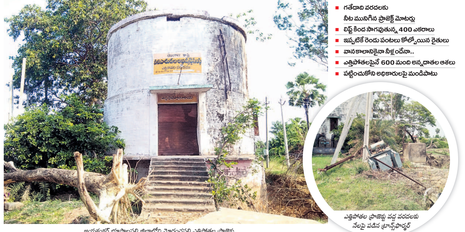
జయశంకర్ భూపాలపల్లి జిల్లాలోని మోరంపల్లి ఎత్తిపోతల ప్రాజెక్టు