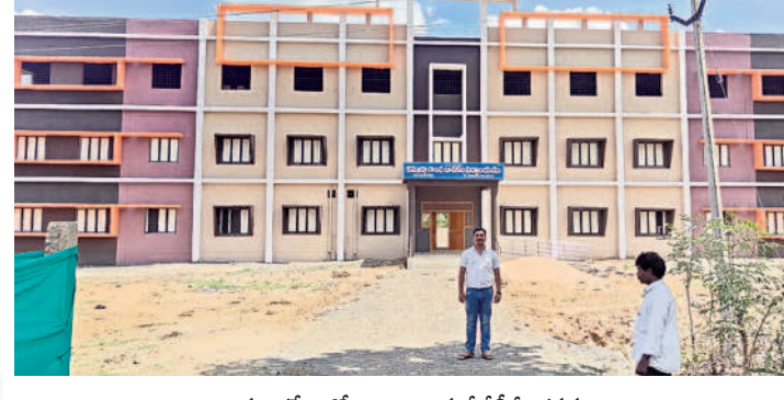
మంగపేటలో నిర్మాణమైన కేజీబీవీ భవనం

■ వినియోగంలోకి వచ్చిన బాలికల విద్యాలయ శాశ్వత భవనం ■ అరకొర వనతుల గదుల్లో అభ్యసించిన విద్యార్థినులకు ఊరట ■ బీఆర్ఎస్ ప్రభుత్వ హయాంలో రూ. 3.30 కోట్లతో నిర్మాణం మంగపేట, జూన్ 16: విద్యార్థులకు సకల సౌకర్యాలతో కసూరా బాలికల విద్యాలయ భవనం వినియోగంలోకి వచ్చింది. ఈ పాఠశాల 2017 నుంచి మంచుపల్లి గిరిజన బాలికల ఆశ్రమ పాఠశాలలో ఇరుకు గదులు, అరకొర వనతుల నడుమ కొనసాగింది. ఈ క్రమంలో కేజీబీవీకి శాశ్వత భవన నిర్మాణం కోసం గత బీఆర్ఎస్ ప్రభుత్వం ఎదుక్కేషన్ వెల్డర్ శాఖ నుంచి రూ. 3.30 కోట్ల మంజూరు చేసింది. మండల విద్యాలయాల కేంద్రం పక్కనే స్థల సేకరణ కూడా పూర్తి చేయడంతో సువిశాలమైన భవనాన్ని నిర్మించారు. గ్రాండ్ ఫ్లోర్లో అభ్యసన నిర్వహణ, తరగతి గదులు, వంటశాల, మొదటి ఫ్లోర్లో విద్యార్థినుల డార్టబర్, భోజనశాల, సెకండ్ ఫ్లోర్లో ల్యాబ్, సమావేశపు హాలు ఏర్పాటు చేశారు. ఈ విద్యాలయంలో ప్రస్తుతం ఆరో తరగతి నుంచి ఇంటర్మీడియట్ వరకు అడ్మిషన్లు ఇచ్చే ప్రక్రియ దాదాపు పూర్తయ్యింది. ప్రతి ఫ్లోర్లో టాయిలెట్లుతోపాటు విద్యార్థినులకు అవసరమైన అన్ని సదుపాయాలతో మూడు అంతస్తులతో నిర్మాణమైన ఈ సువిశాలమైన విద్యాలయం మరో పది రోజుల్లో ప్రారంభం కానున్నది. గతంలో అరకొర వనతుల నడుమ ఇరుగు గదుల్లో కొనసాగిన కేజీబీవీకి శాశ్వత భవనం నిర్మించడంపై విద్యార్థినులు, వారి తల్లిదండ్రులు హర్షం వ్యక్తం చేస్తున్నారు.