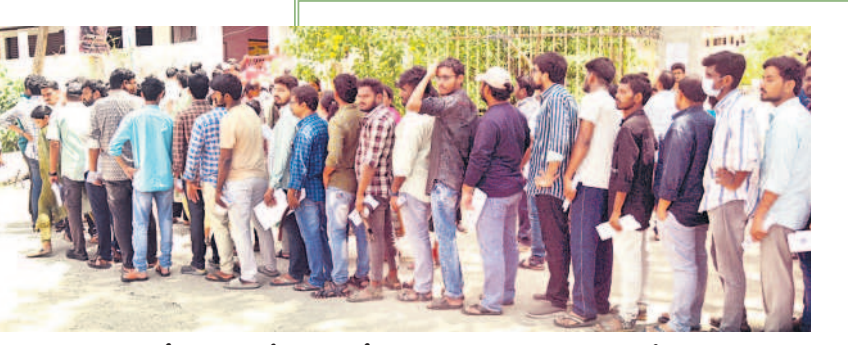
హనుమకొండలోని చైతన్య డిగ్రీ కళాశాలలో సివిల్స్ పరీక్ష రాయడానికి బారులు తీరిన అభ్యర్థులు