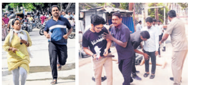
నమయం కావడంతో పరుగున వస్తున్న అభ్యర్థులు