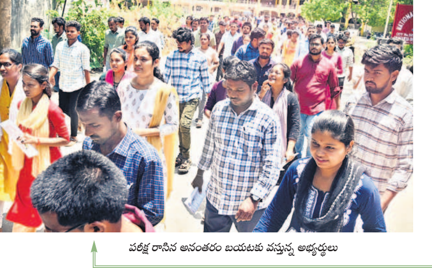
పరీక్ష రాసిన అనంతరం బయటకు వస్తున్న అభ్యర్థులు

చైతన్య డిగ్రీ కళాశాల వద్ద అభ్యర్థులను తనిఖీ చేస్తున్న పోలీసులు