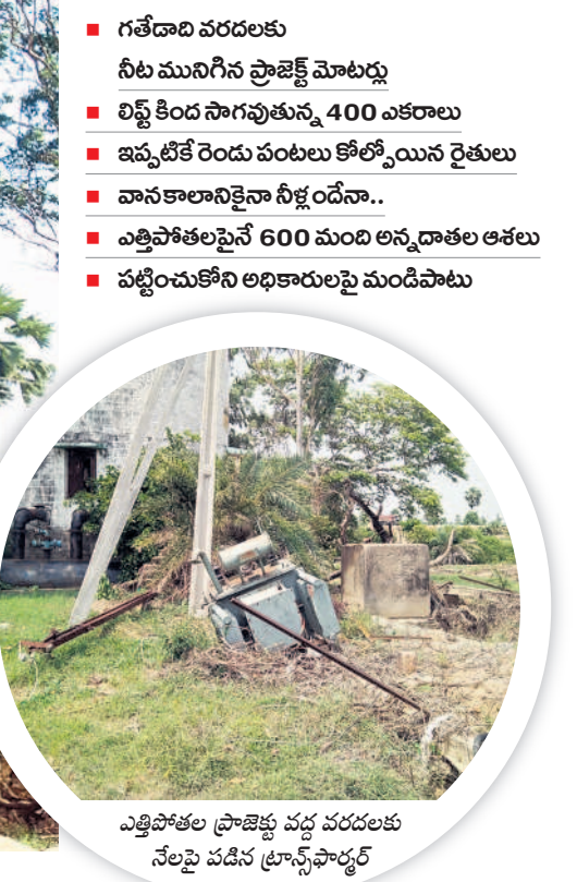
ఎత్తిపోతల ప్రాజెక్టు వద్ద వరదలకు నేలపై పడిన ట్రాన్స్ఫార్మర్