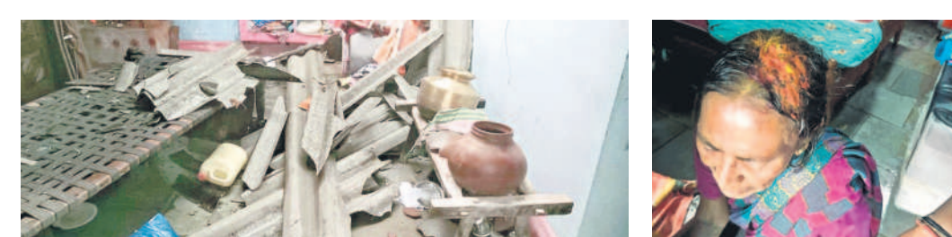
చెన్నూరులో : తుర్కీలో ఇంటిపై కూలిన పైకమ్మ, ఇంటిపై కప్ప కూలడంతో వృద్ధురాలి తలకు గాయం

జన్మారం ఇన్ ఛార్జి రెంజ్ ఆఫీసర్ సుష్రా రావు కుటుంబం ఆసిఫాబాద్ పర్యటించడం