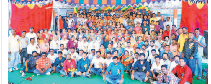
జైహర్ ప్రభుత్వ పాఠశాలలో 2003-04 జ్యూన్ కే చెందిన పూర్వ విద్యార్థులు

మంచీర్యాల పిసీసీ, జూన్ 16 : మంచీర్యాల పట్టణంలోని పాత మంచీర్యాల ప్రభుత్వ ఉన్నత పాఠశాలకు చెందిన 1999-2000 పదో తరగతి జ్యూన్ కే చెందిన పూర్వ విద్యార్థుల సమ్మేళనం ఆదివారం మంచీర్యాల జిల్లా కేంద్రంలోని సురభి ఫంక్షన్ హాల్ లో నిర్వహించారు. రెండు దశాబ్దాల అనంతరం కలుసుకొని యోగక్షేమాలు తెలుసుకున్నారు. ఆ నాటి జ్ఞాపకాలు గుర్తు చేసుకున్నారు. ఈ సందర్భంగా ఉపాధ్యాయులను సన్మానించారు. ఈ కార్యక్రమంలో పూర్వ విద్యార్థులు, ఉపాధ్యాయులు పాల్గొన్నారు.