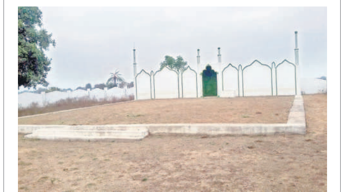
దండేపల్లిలో ముస్తాబైన ఈర్ష్య

దండేపల్లి / చెన్నూర్ టౌన్/ జైహర్, జూన్ 16: ఇబ్రహీం అలీషాస్సాలాం త్యాగానికి ప్రతీకగా ముస్తాబులు జరుపుకునే ఈర్ష్య-ఉల్-అజ్హా(బక్రీద్)కు ఉమ్మడి ఆదిలాబాద్ జిల్లాలోని ఈర్ష్యలు, మనీషులు ముస్తాబయ్యారు. ఎలాంటి అవాంఛనీయ సంఘటనలు జరగకుండా పోలీసులు బందోబస్తు ఏర్పాటు చేశారు.