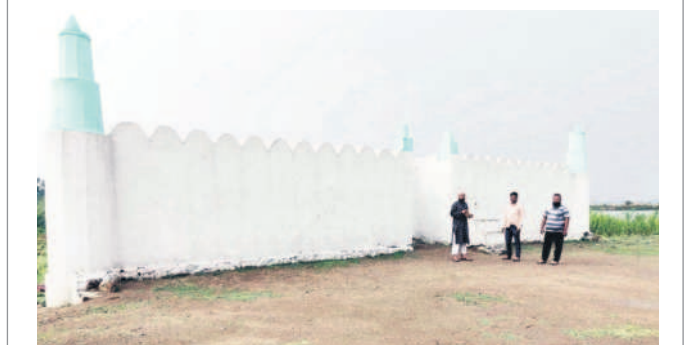
జైహర్ లో ముస్తాబైన ఈర్ష్య

ఖుర్ఆన్ సమర్పించడం ఆసవాదు.. రంజాన్ మాదిరిగానే బక్రీద్ చండుగను కూడా ఖుర్ఆన్ (దార్శిక ప్రసంగం)తో ఈర్ష్యలో సామాజిక ప్రార్థనలు నిర్వహిస్తారు. ఆ తర్వాత నెమరువేసే జంటువులు (ఓంటి, మేక, గొర్రె ) మాత్రమే ఖుర్ఆన్ (బలి) ఇస్తారు. బలి ఇచ్చిన తర్వాత దానిని మూడు భాగాలుగా విభజించి ఒక భాగాన్ని పేదలకు, మరొక భాగాన్ని బంధువులకు పంపతారు. ఇంకో భాగం తమ కోసం ఉంచుకుంటారు. హజ్జ్ చేయలేని వారు కేవలం తామున్న చోట్ అందరూ కలిసి సామాజికంగా సమాజ్ చేసుకోని ఖుర్ఆన్ సమర్పించుకొని పండుగ చేసుకుంటారు.