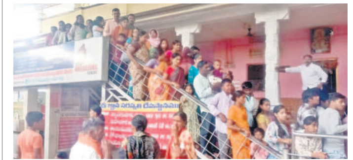
అమ్మవారి దర్శనానికి కూర్చున్న వీధి వీధి భక్తులు

బాసర, జూన్ 16 : బాసర సరస్వతి అమ్మవారి సన్నిహితుల ఆదివారం భక్తుల సందడి కనిపించింది. అమ్మవారి దర్శనానికి రెండు తెలుగు రాష్ట్రాల నుండి కాకుండా మహారాష్ట్ర నుంచి భక్తులు తరలివచ్చారు. ముందు గా గోదావరిలో పుణ్యస్నానాలు ఆచరించారు. అనంతరం అమ్మవారి దర్శనానికి బారులు దీరారు. పాఠశాలలకు పుస్తకాంభోంభం అయిన దృష్ట్యా విద్యార్థులు అత్యధికంగా తరలివచ్చారు. అదే విధంగా భక్తులు తమ చిన్నారిలకు అక్షరశ్రీకార పూజలు చేయించారు. దీంతో అక్షరశ్రీకార మండపాలు భక్తులతో కిక్కిరిసిపోయాయి. అలయ పరిసరాల్లో భక్తుల కోహారం కనిపించింది.