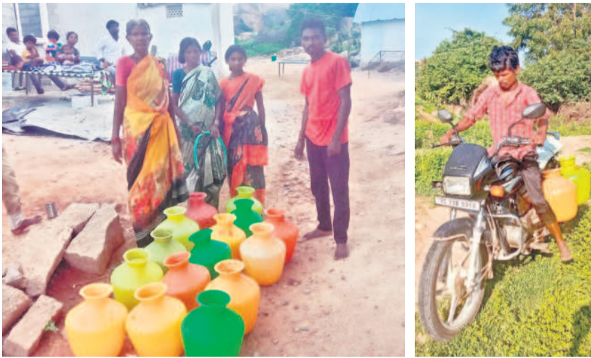
క్యూలో బిందెలు ఉంచిన గ్రామస్థులు, బోరుబావి వద్ద నుంచి బ్రెక్ పై బిందెల్లో నీటిని తీసుకొస్తున్న యువకుడు