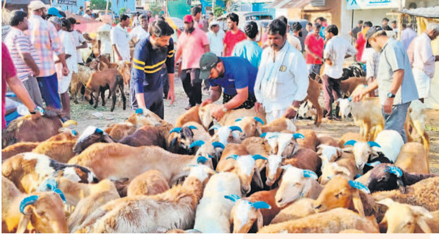
మహబూబ్ నగర్ జిల్లా కేంద్రంలో పాట్లకొండ కొనుగోలు చేస్తున్న ముస్లింలు