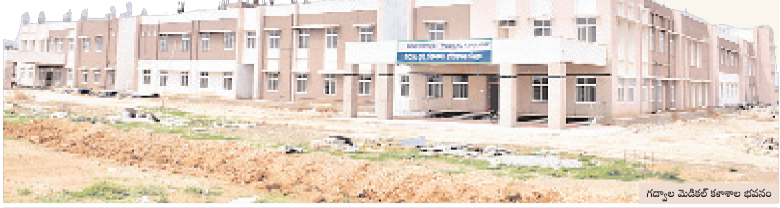
గద్దాల మెడికల్ కళాశాల భవనం

ఈ ఏడాది అందుబాటులోకి.. జోగుళాంబ గద్దాల విద్యార్థులకు 20 24-25 విద్యా సంవత్సరంలో మెడికల్ కళాశాల అందుబాటులోకి రానున్నది. ఒక్కో కళాశాలలో 100 ఎంబీబీఎస్ సీట్లతో తరగతులు ప్రారంభించేలా ప్రభుత్వం చర్యలు చేపట్టింది. కాగా సీట్ల సంఖ్యపై కొంత స్పష్టత రావాల్సి ఉన్నది. కొత్త కళాశాలలో మోతీక నడుపాలంటూ, పడకల సంఖ్యను జాతీయ మెడికల్ కలెక్షన్ పరిశీలింపాలి ఉంది. ఎన్ఎస్ఐ నిబంధనల ప్రకారం ఎంబీబీఎస్ సీట్లకు అనుమతి రావాలంటే ప్రతి కళాశాలలో 21 స్పెషలైజేషన్స్ ని విభాగాలు ఉండాలి. పడకల అక్షయశిష్య ఏటా కనీసం 80కావాలి ఉండాలి. 50 సీట్లకు 220 పడకలు, 100సీట్లకు 420 పడకలు ఉండాలి. దీనిని బట్టి కళాశాలను సీట్ల కేటాయింపు చేస్తారు.