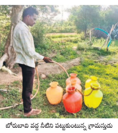
బోరుబావి వద్ద నీటిని పట్టుకుంటున్న గ్రామస్థుడు

ధరూరు, జూన్ 16 : తెలంగాణ రాష్ట్రం ఏర్పాటు యాత్ర బీఆర్ఎస్ ప్రభుత్వం అత్యంత ప్రతిష్టాత్మకంగా చేపట్టిన మున్సిపల్ భగీరథ పథకం లక్ష్యం నీరుగానుతున్నది. మండలంలోని కొత్తపాలెంలో మూడు నెలలుగా తాగునీటి సమస్య ఉన్నా అధికారులు పట్టించుకోవడం లేదని గ్రామస్థులు ఆవేదన వ్యక్తం చేస్తున్నారు. ప్రజావాణిలో ఫిర్యాదు చేసినా ఫలితం లేకపోయిందని నాపోతున్నారు. ప్రజాపాలన అంటే ఇదేనా? మేమే మరచుకుంటున్నామో అని ప్రశ్నిస్తున్నారు. బ్రెన్ మెన్ పోస్ చేస్తే వాటర్ మెన్ పేరు చెబుతున్నాడని.. ట్యాంకర్లోకి నీళ్లు ఎక్కించడం ఇబ్బందవుతుందని పంచాయతీ కార్యదర్శి అంటున్నాడని వాపోయారు. తాగునీటి కోసం బోరు బావుల వద్దకు పోవాల్సిందేనా? అని నిలదీస్తున్నారు.