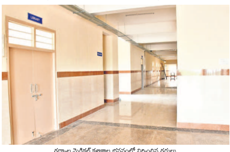
గద్దాల మెడికల్ కళాశాల భవనంలో నిర్మించిన గదులు

పనులు పూర్తి చేయాలని ఆదేశించాం.. ఈ ఆకాడమిలో మెడికల్ కళాశాల ప్రారంభమయ్యే అవకాశం ఉన్నది. మిగిలిన పనులు త్వరగా పూర్తి చేయాలని కాంట్రాక్టర్, అధికారులను ఆదేశించాం. వెనుబడిన గద్దాల జిల్లా మెడికల్ కళాశాల మంజూరు చేయించి, పేదలకు అధునాతన వైద్యం అందించాలన్న నా కోరిక తీరింది. ఈ జిల్లా ప్రత్యేక దృష్టి పెట్టి మెడికల్ కళాశాల మంజూరు చేసిన కేసీఆర్, కేటీఆర్, హరిశ్చంద్రులు ఎప్పటికీ రుణపడి ఉంటారు. జిల్లాకు సర్దిగ కళాశాల మంజూరు చేయగా తరగతులు ప్రారంభమయ్యాయి. మెడికల్ కళాశాల ఏర్పాటుతో ఈ ప్రాంత వైద్య హాట్ గా మారనున్నది. ప్రస్తుత ప్రభుత్వం మెడికల్ కళాశాలకు అవసరమైన ప్యాకట్ల నియామకానికి దరఖాస్తులు అప్లై నింది భర్తీ చేయడం సంతోషంగా ఉన్నది.