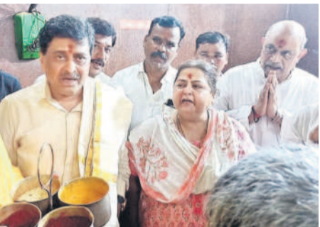
అమ్మవారి సన్నిధిలో మహారాష్ట్ర మాజీ సీఎం, బీజేపీ రాజ్యసభ సభ్యుడు అశోక్ రావు చొహన్