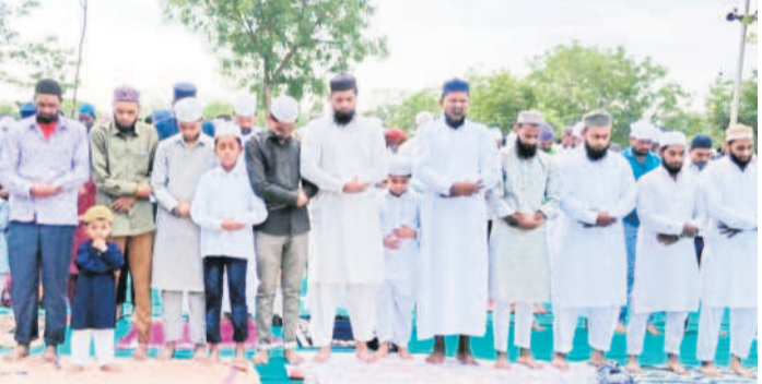
భైంసా : ఈడ్గాల వద్ద ప్రత్యేక ప్రార్థనలు చేస్తున్న ముస్లింలు