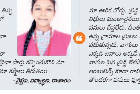
అటవీ అనుమతులే అడ్డంకి

వింది, కాగా, అటవీ అనుమతులు లేని కారణంగా ఈ రోడ్డు పనులు నిలిచిపోగా ప్రతి సంవత్సరం గ్రామస్థులు ఇబ్బందులు పడుతున్నారు. వర్షాకాలం ఈ మార్గం మొత్తం బురదమయం అవుతుండడంతో కాలినడక కూడా కష్టం అవుతుందని గ్రామస్థులు చెబుతున్నారు. 1125 మంది గ్రామస్థులు ఉండే ఈ గ్రామం పైన చిన్నపూవు చూస్తుండడం వల్ల తమకు వర్షాకాలంలో బాహ్య ప్రపంచంతో సంబంధాలు తెగిపోతున్నాయని చెబుతున్నారు. ఈ గ్రామంలోని విద్యార్థులు పై వదుపులు చదవాలంటే ఊరికి మూడు కిలోమీటర్ల దూరంలో ఉన్న బచ్చిరచెలుకు గ్రామానికి కాలినడకనే వెళ్లాలి వస్తుంది. ఈ మార్గంలో వారు ఉండడం వల్ల, అది ఉప్పొంగినప్పుడల్లా ప్రాణాలకు తెగించి స్కూల్ లో వెళ్లాలి వస్తున్నదని విద్యార్థులు చెబుతున్నారు.