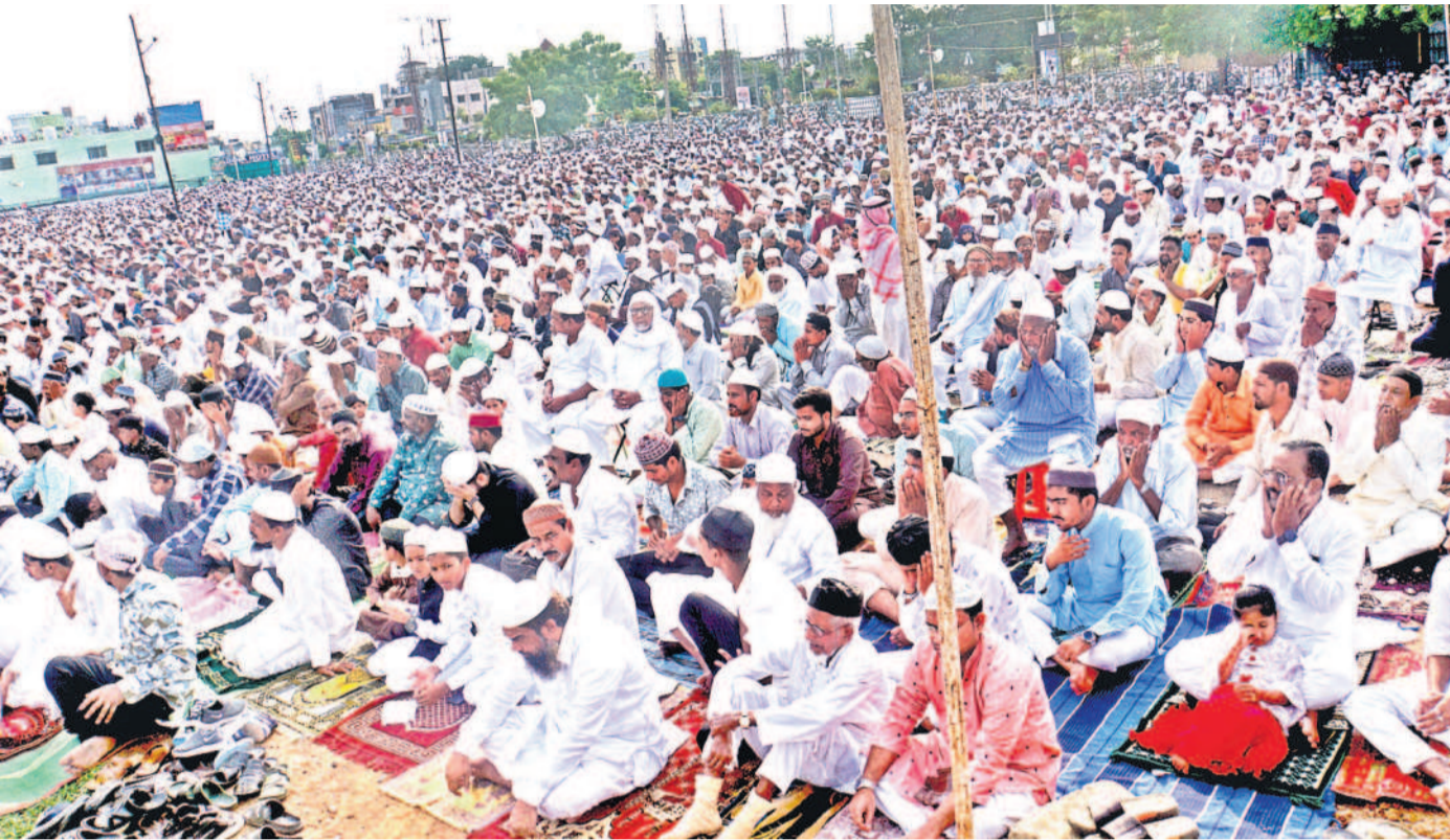
ఆదిలాబాద్ జిల్లాకేంద్రంలోని ఈడ్గా మైదానంలో ప్రార్థనలు చేస్తున్న ముస్లింలు

బాసర సరస్వతీ అమ్మవారిని సోమవారం మహారాష్ట్ర మాజీ సీఎం, బీజేపీ రాజ్యసభ సభ్యుడు అశోక్ రావు చొహన్ సతీసమేతంగా దర్శించుకున్నారు. ఆలయానికి చేరుకున్న వారిని అధికారులు ఘనంగా స్వాగతించారు. అనంతరం అమ్మవారిని దర్శించుకున్న ప్రత్యేక పూజలు నిర్వహించారు.