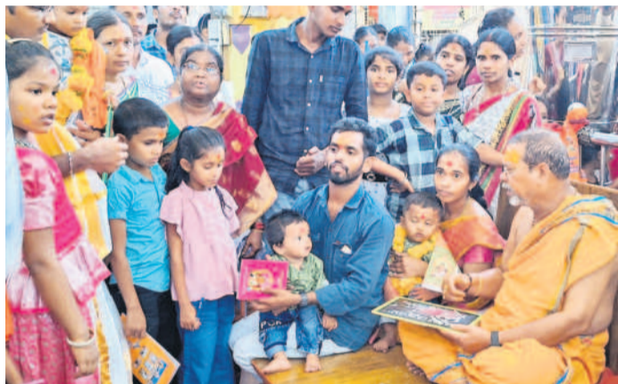
చిన్నారులకు అక్షరశ్రీకార పూజలు నిర్వహించుకుంటున్న భక్తులు

బాసర, జూన్ 17 : నిర్మల్ జిల్లాలోని ప్రసిద్ధ పుణ్యక్షేత్రం సరస్వతీ అమ్మవారు కొలువైన బాసర సోమవారం భక్తులమయం అయింది. వరుస సెలవుల దృష్ట్యా ఆలయానికి భక్తులు తాకిడి పెరిగింది. అదేవిధంగా ఏకాదశి కావడం, పాఠశాలలు పునఃప్రారంభం అవ్వడంతో రెండు తెలుగు రాష్ట్రాల నుండి కాకుండా ఆయా రాష్ట్రాల నుంచి భక్తులు అధిక సంఖ్యలో తరలి వచ్చారు. అమ్మవారి సర్వదర్శన క్యూలైన్లు భక్తులతో కిక్కిరిసి పోయాయి. ఆలయం పరిసరాలూ, బస్టాండ్, గోదావరి ప్రాంతం, రైల్వేస్టేషన్లు భక్తులతో కిక్కిరిసిపోయాయి. అమ్మవారి దర్శనానికి సుమారు మూడు గంటలు పట్టింది. క్యూలో ఉన్న చిన్నపిల్లల కోసం మజ్జిగ, నీటిని ఆలయ అధికారులు పంపిణీ చేశారు. భక్తులకు ఇబ్బందులు కలుగకుండా చర్యలు తీసుకున్నారు. సుమారు 20 వేల మంది అమ్మవారిని దర్శించుకున్నట్లు ఆలయ అధికారులు తెలిపారు. అమ్మవారి దర్శనానికి వచ్చిన భక్తులకు తమ పిల్లలకు అక్షరశ్రీకార పూజలు చేయించుకున్నారు. 1,620 మంది అక్షరాభ్యాసాలు చేయించుకున్నట్లు ఆలయ అధికారులు తెలిపారు.