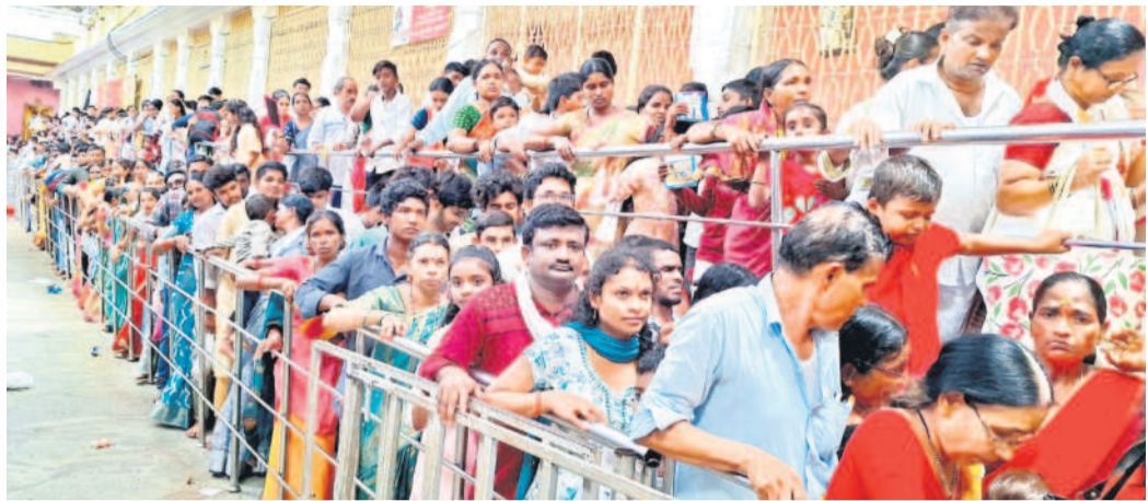
అమ్మవారి దర్శనానికి క్యూలో వేచి ఉన్న భక్తులు