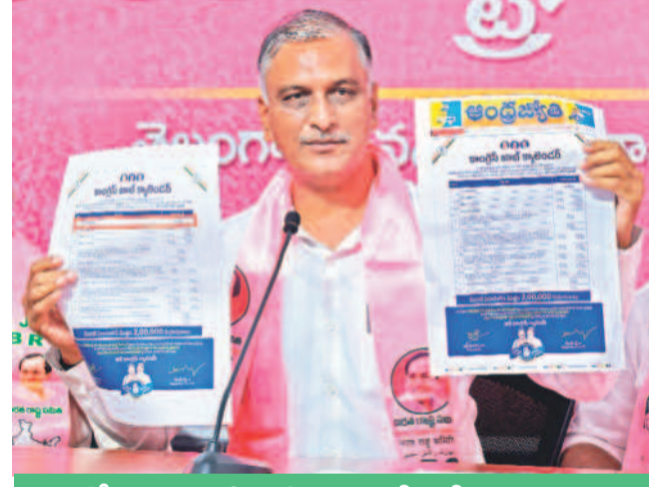
నిరుద్యోగుల తరపున ప్రభుత్వానికి 5 డిమాండ్లు