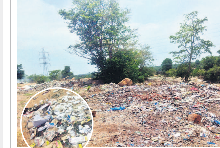
క్రీడా ప్రాంగణంలో పేదరుపోయిన చెత్తాచెదారం

ప్రాంగణం ఆవరణలో వేస్తుండడంతో క్రీడల నిర్వహణకు తీవ్ర ఇబ్బందులు వచ్చాయి. క్రీడా ప్రాంగణంలో చెత్త వేయడంతో అటలు ఆడడానికి వీలు లేకుండా పోయిందని యువకులు ఆవేదన వ్యక్తం చేస్తున్నారు. పంచాయతీ అధికారులు స్పందించి క్రీడా ప్రాంగణంలో చెత్త వేయకుండా చర్యలు తీసుకోవాలని కోరుతున్నారు.