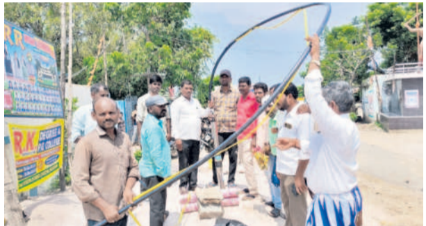
బోర్మోటార్ ను బిగిస్తున్న నాయకులు