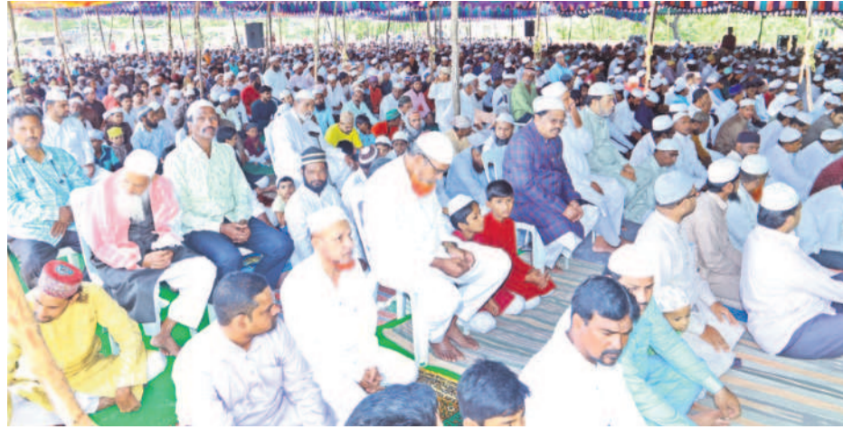
కామారెడ్డిలోని ఈడా వద్ద ప్రార్థనలు చేస్తున్న ముస్లింలు