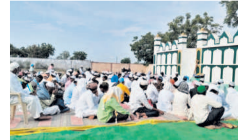
బిచ్చందలో ఈడాలో ప్రార్థనలు చేస్తున్న ముస్లింలు