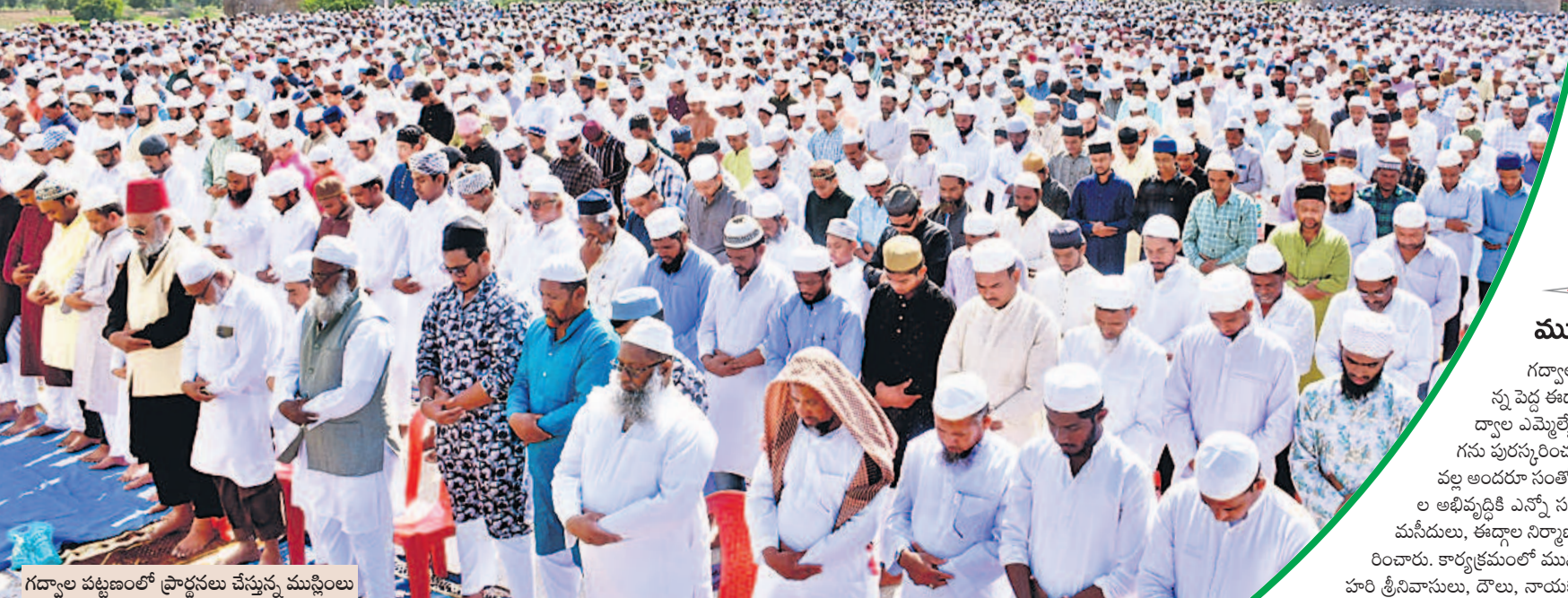
గద్వాల పట్టణంలో ప్రార్థనలు చేస్తున్న ముస్లింలు