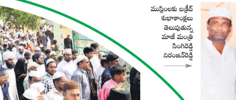
మహబూబ్ నగర్ లో ఈ ధాన్య వద్ద ముస్లింలు