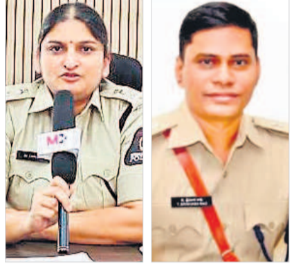
జానకి ధరావత్, శ్రీనివాసరావు

• పాలమూరు ఎస్పీగా జానకి ధరావత్, గద్వాల ఎస్పీగా శ్రీనివాసరావు మహబూబ్ నగర్ / గద్వాల అర్బన్, జూన్ 17 : రాష్ట్ర వ్యాప్తంగా వివిధ జిల్లాల్లో విధులు నిర్వహిస్తున్న పోలీస్ అధికారులకు స్థానచలనం కల్పిస్తూ ప్రభుత్వ నిర్ణయం తీసుకున్నది. అందులో భాగంగా మహబూబ్ నగర్ జిల్లా పోలీస్ బాస్ గా జానకి ధరావత్ ను నియమిస్తూ ప్రభుత్వ ప్రధాన కార్యదర్శి శాంతికుమారి సోమవారం రాత్రి ఉత్తర్వులు జారీ చేశారు. రాష్ట్ర వ్యాప్తంగా జూన్ నెల 28 మంది ఎస్పీలను బదిలీ చేయగా 2013 ఏప్రిల్ నుంచి జూన్ వరకు జానకి ధరావత్ ఈస్ట్ జిల్లాలో మహబూబ్ నగర్ పోలీస్ బాస్ గా బదిలీ చేశారు. ఈ మేరకు మహబూబ్ నగర్ డి.సి.పీగా పనిచేశారు. ఇక్కడ పనిచేస్తున్న హద్దపర్లకు హైదరాబాద్ సైబర్ సెక్యూరిటీ బ్యూరోగా పోస్టింగ్ ఇచ్చారు. జానకి ధరావత్ మంగళవారం