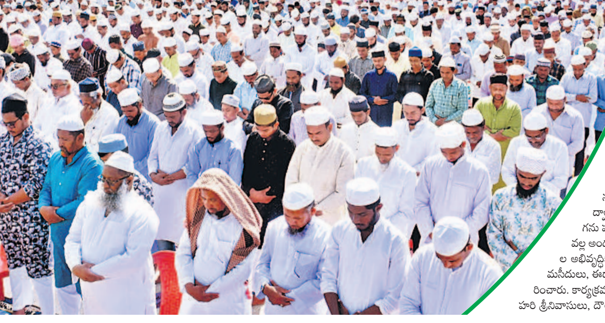
గద్వాల పట్టణంలో ప్రార్థనలు చేస్తున్న ముస్లింలు