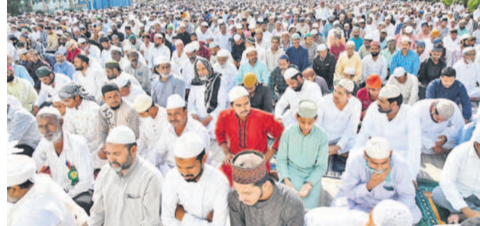
సిద్దిపేట: సిద్దిపేట ఈడ్గా మైదానంలో ప్రార్థనలు చేస్తున్న ముస్లింలు