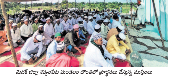
మెదక్ జిల్లా శివ్వంపేట మండలం దొంతిలో ప్రార్థనలు చేస్తున్న ముస్లింలు