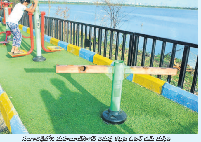
సంగారెడ్డిలోని మహబూబ్ సాగర్ చెరువు కట్టపై ఓపెన్ జిమ్ దుస్థితి

ప్రజాలోగ్య పరిరక్షణ అక్షరంగా బీఆర్ఎస్ హయాంలో ఏర్పాటు చేసిన ఓపెన్ జిమ్ల నిర్వహణను అధికారులు గాలికి వదిలివేశారు. దీంతో వ్యాయామం చేసేందుకు వచ్చిన వారికి అసౌకర్యం తప్పడం లేదు. సంగారెడ్డి పట్టణంలోని రాజీవ్ పార్కులో ఏర్పాటు చేసిన వ్యాయామ వస్తువులు దెబ్బతిని మూలం పడ్డాయి. వాటికి మరమ్మత్తులు చేయాల్సిన అధికారులు పట్టించుకోవడం లేదు. సంగారెడ్డిలోని మహబూబ్ సాగర్ చెరువు కట్టపైన ఏర్పాటు చేసిన ఓపెన్ జిమ్లో కూడా వ్యాయామ వస్తువులు దెబ్బతిన్నాయి. - సంగారెడ్డి ఫోటోగ్రాఫర్, జూన్ 17