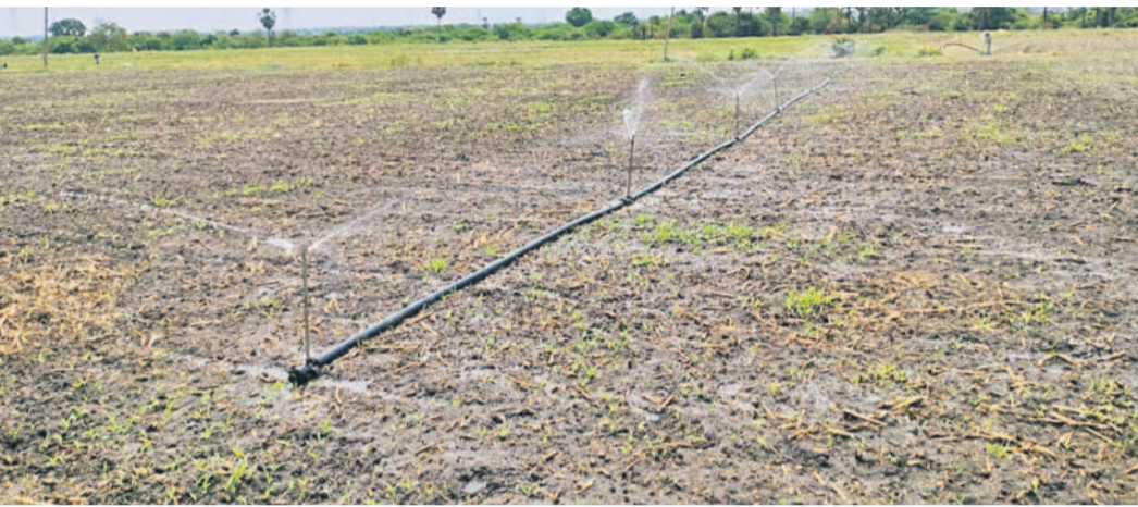
సిద్దిపేట జిల్లా బూరుగుపల్లిలో స్ప్రింకలర్లతో పత్తి గింజలకు నీళ్లు పెడుతున్న దృశ్యం