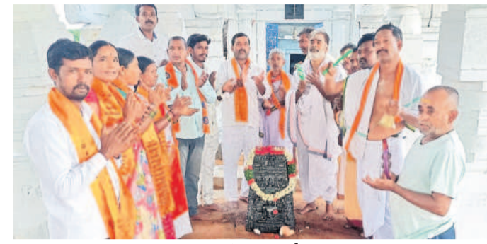
జైన చౌముఖి శిల్పానికి పూజలు చేస్తున్న గ్రామస్థులు