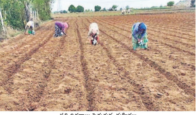
పత్తి విత్తనాలు పెడుతున్న మహిళలు

నాలనే ఎక్కువగా సాగు చేస్తున్నారు. అందుకు అనుగుణంగా మార్కెట్లో రైతులకు సరిపడా విత్తనాలను అందుబాటులో ఉంచారు. గతేడాది పత్తి క్వింటాలుకు రూ.7020 వరకు ధర