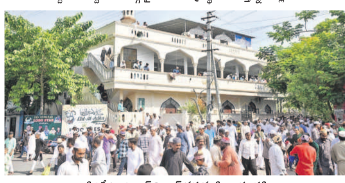
సిద్దిపేట: ఎక్కాల్ మినార్ వద్ద ముస్లింల సందడి