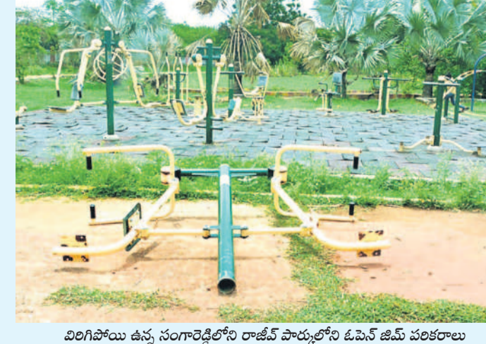
విలిగోయి ఉన్న సంగారెడ్డిలోని రాజీవ్ పార్కులోని ఓపెన్ జిమ్ పరికరాలు