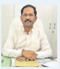
వికారాబాద్ జిల్లా అటవీ శాఖ అధికారి

అటవీ భూములను కబ్బా చేయడం చట్టరీత్యా నేరం. ఫారెస్టు భూములను కబ్బా చేసి చెట్లను నరుకుతూ రుజువులతో పట్టుబడితే కఠిన చర్యలు తప్పవు. గ్రామ స్థులు కూడా అటవీ సంపదను కాపాడుకోవాలి.