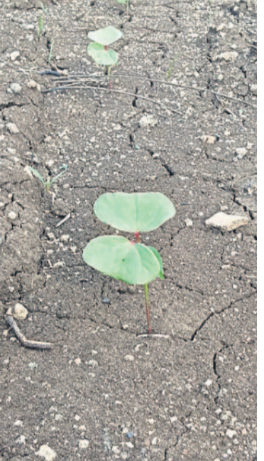
కురిసిన సాధారణ వర్షపాతానికి ముప్పుల మండలంలోని ఓ గ్రామంలో మొలకెత్తిన పత్తి విత్తనాలు

రంగారెడ్డి, జూన్ 18(నమస్తే తెలంగాణ) : ఈ సీజన్లో సాధారణం కన్నా అధిక వర్షపాతం నమోదవుతుందిని ఐఎండీ శాస్త్రవేత్తలు అంచనా వేసినా.. జిల్లాలో మాత్రం ఆశించిన స్థాయిలో వానలు కురవడంలేదు. నగరాల్లో భారీగా కురుస్తున్న వర్షం.. గ్రామీణ ప్రాంతాల్లో ఉండడంలేదు. ఫలితంగా వానకాలం సీజన్ పనులు నేటికీ ఊపందుకోలేదు. ఇంకా చాలామంది రైతులు విత్తనాలు వేసి సాగునీలం చేయలేక.. పుస్తాలోపనలో చుక్కారు. ఇప్పటికే విత్తనాలు వేసిన వారు.. ఆందోళన చెందుతున్నారు. సీజన్ ప్రారంభంలోనే కాలం కలిసి రాకపోవడంతో జిల్లా రైతాంగం కలవరపడుతున్నది.