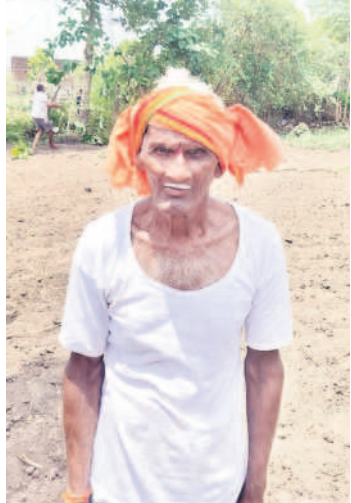
-రాళ్ళబండి పోషం, రైతు, కోటపల్లి

కోటపల్లి, జూన్ 19 : కాంగ్రెస్లో అనాటి రోజుల తొలుతుండే.. ఏమీ అనుకున్నం. గిట్లూ మళ్ళా రైతులను గోస పెడుతరనుకోలే. ఎప్పుడో గిట్లూ రైతులను సరిగ్గా ఇస్తలేరు. ఇప్పుడు వచ్చినట్లు కోతలు పెడుతున్నారు. 24 గంటల పాటు కరెంటును మునుపటి దాని వలె తూసి రాత్రి పూట బండి చేస్తున్నారు. పగలు మాత్రమే అరకేర కరెంటును పంటలు ఎలా పండుతాయో సీఎంకే తెలుసుకోలే. రేవంత్ సర్కారు రైతులను మోసం చేస్తున్నది. రెప్పపాటు కరెంటు పోకుండా కేసీఆర్ కరెంటును.. గీ కాంగ్రెస్లో రైతులను అరిగోస పెడుతున్నారు. ముందే అనుకున్నం గీ కాంగ్రెస్లో వస్తే మళ్ళా గోసపడుడే అని. ఇప్పుడు గట్లనే అయితంది.