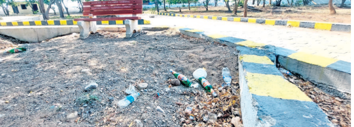
పాతమంచరాలలోని పార్కులో మధ్యం సీసాలు

మంచెలపైకి దూకేసి దూరంగా తరలించారు. ఈ ఘటనతో చిన్నారుల తల్లిదండ్రులు భయాందోళనకు గురయ్యారు. ఇటీవల కుక్కల దాడులు ఎక్కువయ్యాయని, బయటకు వెళ్లాలంటే జంతుకూతులను, ఇక్కడనుండి అధికారులు స్పందించి ఈ సమస్యకు పరిష్కారం చూపాలని స్థానిక ప్రజలు కోరుతున్నారు.