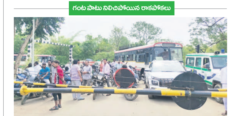
వేంపల్లి సమీపంలోని రైల్వే గేటు మొరాయిచడంతో నిలిచిన వాహనాలు

సిర్పూర్ (టీ), జూన్ 19 : సిర్పూర్ (టీ)-కాగజేనగర్ ప్రధాన రహదారిలోని వేంపల్లి గ్రామ సమీపంలోని రైల్వే గేటు బుద్ధవారం ఉదయం సాంకేతిక కారణాలతో మొరాయిచింది. ఫలితంగా గంట పాటు వాహనాల రాకపోకలు నిలిచి ప్రయాణికులు తీవ్ర ఇబ్బందులు పడాల్సి వచ్చింది. సిర్పూర్ (టీ)లో పాటు కొంటాల, చింతలమానేపల్లి, బెజ్జర్ మండలాలతో పాటు మహారాష్ట్రకు వెళ్లే రహదారి కావడంతో గేటుకు ఇరువైపులా కిలోమీటరు మేర వాహనాలు నిలిచిపోయాయి. రైల్వే సిబ్బంది మరమ్మత్తు చేసిన తర్వాత వాహనాలు కదిలాయి. ఏళ్లకేళ్లుగా ఈ సమస్యతో ఇబ్బందులు పడుతున్నామని, రైల్వే ఓవర్ బ్రిడ్జి పనులు త్వరగా పూర్తి చేసి, ప్రయాణాలకు అందజాటులోకి తీసుకురావాలని ప్రజలు, వాహనదారులు కోరుతున్నారు.