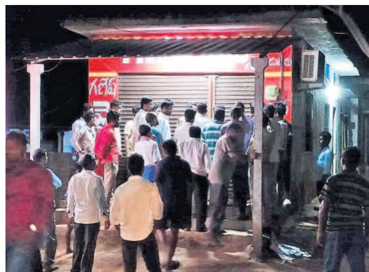
మహబూబాబాద్ జిల్లా గూడూరులో వైన్ షాపు ఎదుట అందోళన చేస్తున్న స్థానికులు

రెప్పపాటు కూడా కరెంటు కోత లేదు రాష్ట్రంలో మిగులు విద్యుత్తు ఉంది ఉప ముఖ్యమంత్రి భట్టి విక్రమార్కు సృష్టికరణ > 2