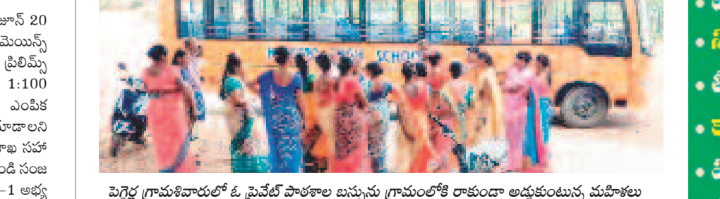
పెగ్గెడ్ల గ్రామశివారులో ఓ ప్రైవేట్ పాఠశాల బస్సును గ్రామంలోకి రాకుండా అడ్డుకుంటున్న మహిళలు

కథలాపూర్, జూన్ 20 : తమ గ్రామంలోకి ప్రైవేట్ పాఠశాల బస్సులు రావద్దని కథలాపూర్ మండలం పెగ్గెడ్ల గ్రామ మహిళలు గురువారం అడ్డుకొని వాపస పంపించారు. గ్రామస్థుల వివరాల ప్రకారం.. గ్రామంలోని ప్రభుత్వ ప్రాథమికోన్నత పాఠశాలలో ఒకటి నుంచి ఎనిమిదో తరగతి వరకు 72 మంది విద్యార్థులు, 8 మంది ఉపాధ్యాయులు ఉన్నారు. గ్రామానికి చెందిన విద్యార్థులు వివిధ ప్రైవేట్ పాఠశాలల్లో 100 మంది చదువుకుంటున్నారు. ఇలా అయితే గ్రామ ప్రభుత్వ పాఠశాల మానేసిన పరిస్థితులు వస్తాయని మహిళలందరూ సమావేశమై గ్రామానికి ప్రైవేట్ పాఠశాల బస్సులను రానీయవద్దని నిర్ణయించుకున్నారు. ఈ మేరకు గురువారం ఉదయం వాటిని అడ్డుకున్నారు. గ్రామంలోని విద్యార్థులను స్థానిక ప్రభుత్వ పాఠశాలలోనే చేర్పించాలని నిర్ణయించారు. సుమారు రెండు గంటల పాటు గ్రామస్థులు, మహిళలు గ్రామశివారులో రోడ్డుపై నిలబడి ప్రైవేట్ పాఠశాల బస్సులు రాకుండా చూశారు.