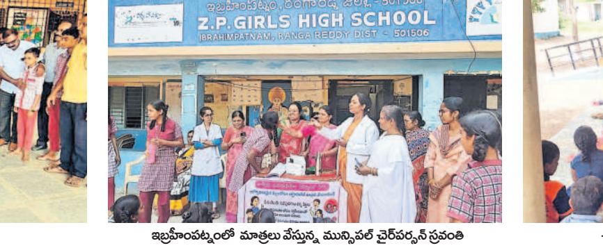
ఇబ్రహీంపట్నంలో మాత్రలు పంపిణీ, మున్సిపల్ చైర్మన్ సంతకం