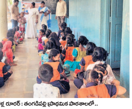
చేపేటి దూరం: తండ్రిపల్లి ప్రాథమిక పాఠశాలలో..