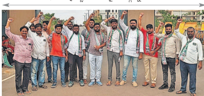
కలెక్టరేట్ ఎదుట ఆందోళన చేస్తున్న సేవాలాల్ సేన నాయకులు