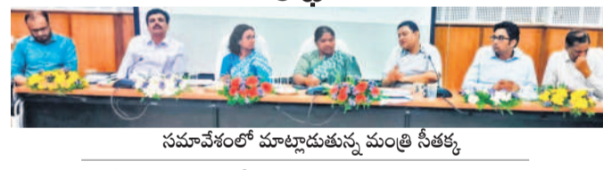
సమావేశంలో మాట్లాడుతున్న మంత్రి సీతక్క