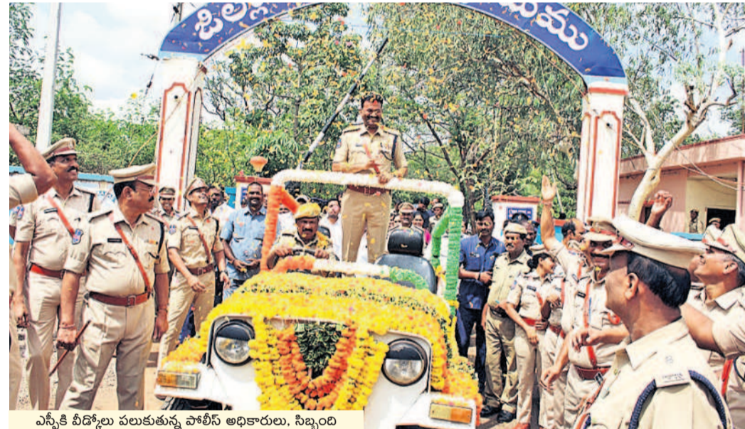
ఎస్సీ వీడ్కోలు పలుకుతున్న పోలీస్ అధికారులు, సిబ్బంది

వికారాబాద్, జూన్ 20 : వికారాబాద్ ఎస్సీ కోటిరెడ్డి 28/12/2021 నుంచి విధులు నిర్వహించి, మేజర్ డి.పి.ఎ. బదిలీ పుష్పంపై సందర్భంగా ఎస్సీకి జిల్లా పోలీసు అధికారులు, సిబ్బంది గురువారం ఎస్సీ కార్యాలయంలో ఘనంగా అత్యున్న వీడ్కోలు పలికారు. పోలీసు కమాండర్ నిర్వహించారు. గౌరవ వందనం స్వీకరించారు. ఈ సందర్భంగా ఎస్సీ మాట్లాడుతూ.. జిల్లాలో ఎలాంటి అవాంఛనీయ సంఘటనలు జరుగుతుంటే చూసినట్లు చెప్పారు. హోం గార్డులను పైస్థాయి అధికారి వరకు సమయస్థూర్తి పని చేయడంతో శాంతిభ