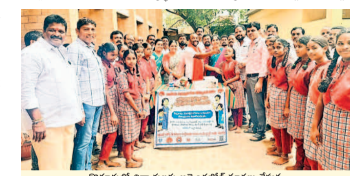
కొత్తూరులో చిన్నారులకు అల్లెంజోలీ మాత్రలు పంపిణీ