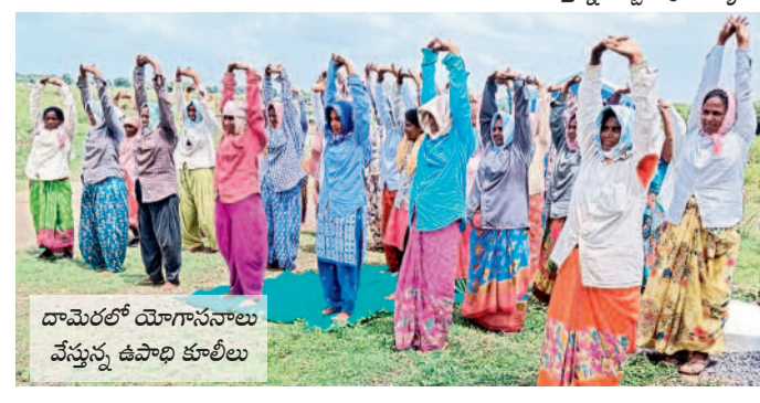
దామెరలలో యోగాసనాలు వేస్తున్న ఉపాధి కూలీలు