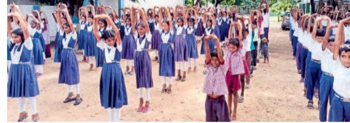
నర్తనంపేట రూరల్: యోగా చేస్తున్న ఇటుకాలపల్లి హైస్కూల్ విద్యార్థులు

గ్లత్ రోడ్డు ప్రమాదకరంగా ఉన్నాయని, అధికారుల దృష్టికి తీసుకెళ్లినా పట్టించుకోవడం లేదని ఆందోళన వ్యక్తం చేశారు. అలాగే, సూపర్ స్పెషాలిటీ సీనియర్ రెసిడెంట్స్ కోసం సబ్ రిండ్ల గౌరవ వేతనం ఇవ్వాలని, తమ డిమాండ్లను విద్యుత్తును కంటి మీద కునుకు లేకపోతుంటే ఈ నెల 24 నుంచి అత్యవసర సేవలు మినహా విధులు లేవని, వెంటనే భర్తీ చేయాలని డిమాండ్ చేశారు. కాకతీయ మెడికల్ కళాశాలలో అంత