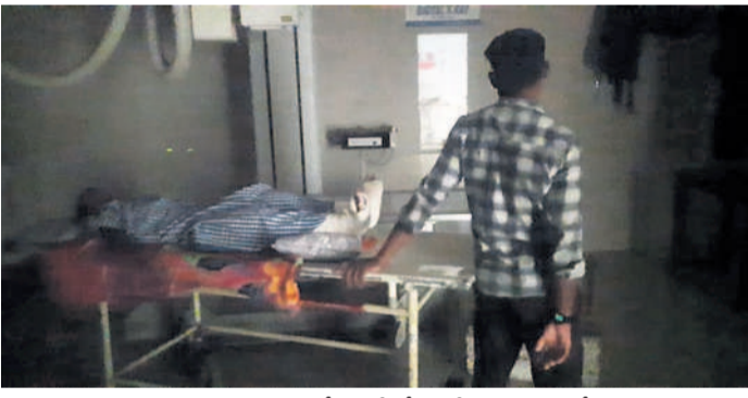
విద్యుత్ అంతరాయంతో ఎక్స్ కేసీఎం వేలి చూస్తున్న రోగులు

కాశీబుగ్గ, జూన్ 21: పరంగల్ ఎంజీఎం దవాఖానలో మళ్లీ కరెంట్ అంతరాయం ఏర్పడింది. దీంతో రోగులు, ఆటోడెంట్లు, వైద్యులు ఇబ్బందులకు గురయ్యారు. శుక్రవారం ఉదయం 10 నుంచి మధ్యాహ్నం 12 గంటల వరకు విద్యుత్ సరఫరా నిలిచిపోయింది. జనరల్ ఓపి, క్యాజు వాలిటీ వార్డుల్లో ఎక్స్, స్పానింగ్, రక్త పరీక్షలు ఆరువయిండు వారాల సమయం వేచి ఉన్నారు. రోగుల వైద్య పరీక్షలు, ఇతర రిపోర్ట్స్ అంద మధ్యమధ్యలో చాలా సార్లు విద్యుత్ కు అంతరాయం కలుగుతుండడంతో కరెంట్ తో