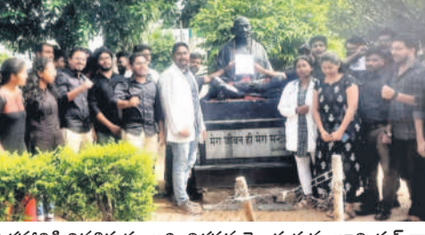
గాంధీ విగ్రహానికి వినతిపత్రం ఇచ్చి నిరసన తెలుపుతున్న జూనియర్ డాక్టర్లు

నిరసన మౌలిక వసతులు కల్పించాలన్నారు. నెలనెలా ఉపకార వేతనాలు ఇవ్వకుండా వారం నలుపురంగు దుస్తులు ధరించి తరగతులకు హాజరున్నారు. అనంతరం ఎంజీఎం దవాఖాన ఆవరణలోని గాంధీ విగ్రహానికి వినతిపత్రం అందించని నిరసన తెలిపారు. ఈ సందర్భంగా వారు మాట్లాడుతూ దవాఖానకు వచ్చే పేద, మధ్య తరగతి ప్రజలకు మెరుగైన వైద్యం అందించాలంటే తప్ప