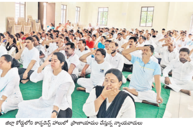
జిల్లా కోర్టులోని కాన్వెన్షన్ హాలులో ప్రాణాయామం చేస్తున్న న్యాయవాదులు

ఉమ్మడి జిల్లాలో శుభ్రవారం అంతర్జాతీయ యోగా దినోత్సవం మనంగా నిర్వహించారు. ఈ సందర్భంగా వివిధ స్వచ్ఛంద సంఘాల అధ్యక్షులతో ఏర్పాటు చేసిన కార్యక్రమాల్లో ప్రజాప్రతినిధులు, అధికారులు, యువకులు పాల్గొని యోగాసనాలు వేశారు. యోగా ప్రాచుర్యం పలువురు యోగా గురువులు వివరించారు. పలుబోధ యోగా ప్రాధాన్యంపై అవగాహన కల్పిస్తూ రా్యలీ చేపట్టగా.. విద్యార్థులు, యువకులు పెద్దసంఖ్యలో పాల్గొన్నారు.