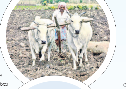
గతేడాది ప్రాజెక్టులో నీటి నిల్వలు తక్కువగా ఉన్నా అప్పటి కేసీఆర్ ప్రభుత్వం రైతుల ఇబ్బందులను దృష్టిలో ఉంచుకొని నీటిని విడుదల చేసింది. ఈ సంవత్సరం ప్రాజెక్టులో సాగు కోసం నీళ్లు ఉన్నా విడుదల చేయడంలో ప్రస్తుతం ప్రభుత్వం నిర్లక్ష్యంగా వ్యవహరిస్తోంది. ఇప్పటి వరకు అజీమిన స్థాయిలో వర్షాలు కురవకపోవడంతో రైతులు నిజాంసాగర్ ప్రాజెక్టు నీటివిడుదలపైనే గంపెడా శీలు పెట్టుకున్నారు.

వానకాలం ప్రారంభమై సుమారు 20 రోజులు అవుతున్నా ఇప్పటి వరకు అజీమిన స్థాయిలో వర్షపాతం నమోదుకా లేదు. నిత్యం ఉరుములు, మెరుపులు, గాలిదుమారం రేగడంతో వర్షం కురుస్తుం దేమీనని రైతులు ఆశగా ఆకాశం వైపు చూస్తున్నారు. సాగునీటి సౌలభ్యం ఉన్న బోరుబావుల వద్ద కొందరు రైతులు ముందస్తుగానే నారుమడులు వేసుకు న్నారు. వ్యవసాయశాఖ సూచనల మేరకు మిగిలిన వారు నారుమడులు వేసి, వర్షాలు కురిస్తే నాట్లు వేయడానికి రైతులు దుక్కులు దున్ని పొలాలను సిద్ధం చేసుకు