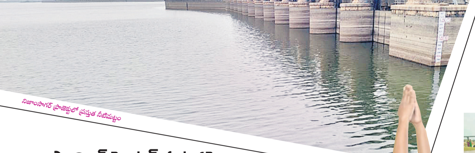
నిజాంసాగర్ ప్రాజెక్టులో ప్రస్తుత నీటిమట్టం

సోయాబీన్, పత్తి, పెసర, మినుము, తొగగు, చెరుకు, వేరు శనగ తదితర) సాగుకు అధికారులు అంచనాలు రూపొందించారు. కానీ వర్షాలు కురవకపోవడం, నిజాంసాగర్ నీటి విడుదల చేయక పోవడంతో మక్కజొన్న 9500, సోయా బీన్ 1900, చెరుకు 30, తొగగు 200 ఎకరాల్లో సాగుచేసినట్లు వ్యవసాయ శాఖ అధికారులు తెలిపారు. వర్షాభావ పరిస్థితులు తలెత్తితే వేసిన పంటలు మొలకెత్తకపోవచ్చని రైతులు ఆందోళన చెందుతున్నారు.