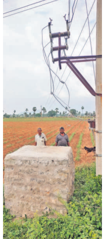
జనగామ జిల్లా దేవరపల్లెలో కాలిని ట్రాన్స్ ఫార్మర్ గడ్డ