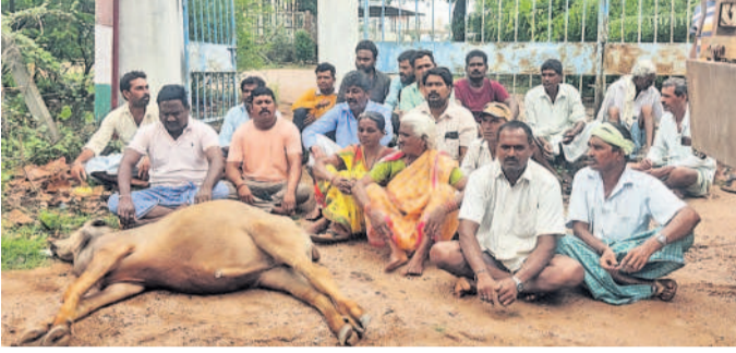
బుర్రెల కళేబరాలతో విద్యుత్తు సబ్స్ క్రిస్టిన్ ఎదుట ఆందోళన చేస్తున్న రైతులు, గ్రామస్థులు

వానకాలం నెత్తి మీదికి వచ్చింది. నారు పోసినం. నీళ్లు లేక నాలు రేలుతున్నాయి. రెండు ఆవులకు తాగడానికి నీళ్లు లేక దూరం నుంచి బకిట్లకు తెచ్చి తావుతున్నాయి.