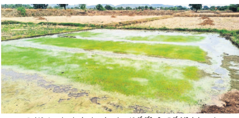
పెద్దపల్లి జిల్లా ధర్మారం మండలం నర్సంపాలపల్లిలో రోహిణి కార్టెల్లో పోసిన వరి నారు