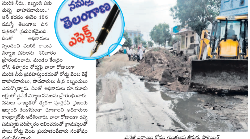
డ్రైనేజీ నిర్మాణం కోసం గుంటలను తీస్తున్న పొక్లెయిన్

గాంధారి, జూన్ 22 : 'రోడ్డుపై మురికి నీరు.. ఇబ్బంది పడుతున్న వాహనదారులు.. అనే కథనం ఈనెల 19న నమస్తే తెలంగాణ దినపత్రికలో ప్రచురితమైంది. దీంతో అధికారులు స్పందించి మురికి కాలువ నిర్మాణ పనులను శనివారం ప్రారంభించారు. మండల కేంద్రంలోని తిప్పారం రోడ్డుపై చాలా రోజులుగా మురికి నీరు ప్రవహిస్తుండడంతో రోడ్డు వెంట వెళ్లే వాహనదారులు, పాదచారులు తీవ్ర ఇబ్బందులు ఎదుర్కొన్నారు. దీంతో అధికారులు రూ.మూడు లక్షలతో డ్రైనేజీ నిర్మాణ పనులను ప్రారంభించారు. పనులు నాణ్యతతో త్వరగా పూర్తిచేసి ప్రజలకు ఇబ్బంది కలుగుకుండా చూడాలని అధికారులు కాంట్రాక్టర్ కు ఆదేశించారు. చాలా రోజులుగా ఉన్న సముద్రపు పరిష్కారం లభించడంతో గ్రామస్థులతో పాటు రోడ్డు వెంట ప్రయాణించేవారు సంతోషం వ్యక్తం చేస్తున్నారు.