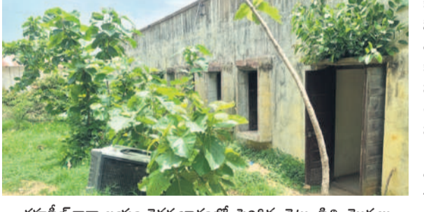
తహసీల్ కార్యాలయం వెనక భాగంలో పెరిగిన చెట్లు, వీటి మొక్కలు

కార్యాలయం వద్ద పెరిగిన పిల్లల మొక్కలను మాత్రం తొలగించారు. ఇవి ఎక్కడో కాదు.. నాగిరెడ్డిపేట తహసీల్ కార్యాలయం వద్దనే.. ఆదర్శంగా ఉండాలన్న తహసీల్ ఆఫీసు ఇలా ఉండడంపై ప్రజలు ఆవేదన వ్యక్తం చేస్తున్నారు. కార్యాలయ గోడలపై చెట్లు పెరిగాయని, పిల్లల మొక్కలు పెరగడంతో చివరకు కార్యాలయంలోకి