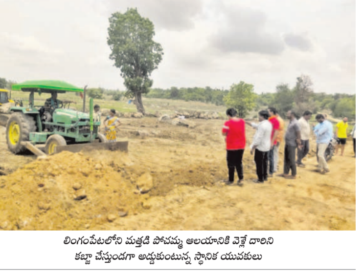
లింగంపేటలోని మత్తడి పోలీస్ స్టేషన్ వెళ్లే దారిని కట్టా వేస్తుండగా అడ్డుకుంటున్న స్థానిక యువకులు