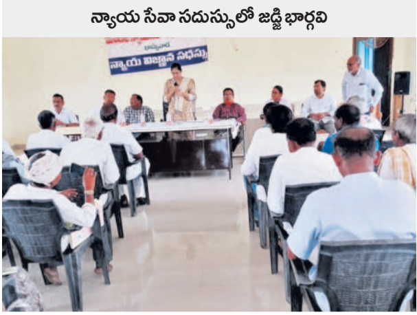
న్యాయ సేవా సదుస్థులో జడ్జి భార్యలను