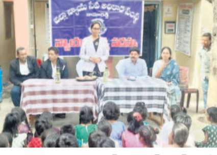
మాట్లాడుతున్న ఆడిషన్ల జూనియర్ సివిల్ ఇంజనీర్