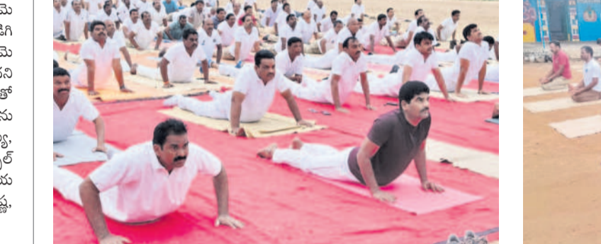
యోగాసనాలు వేస్తున్న పోలీసులు