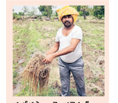
మళ్లీ కష్టాలు మొదలైనయో..

రోజుకు రూ. 200 నష్టపోతున్నాం.. హనుమకొండ, జూన్ 22 : తెలంగాణ రాష్ట్రం ఏర్పాటు ముందు పద్ద కరెంట్ కష్టాలు మళ్లీ మొదలైనాయి. కేసీఆర్ పాలనలో ఏ ఒక్క రోజు కరెంట్ పోలేదు. ఇప్పుడు రోజుకు రెండు, మూడు సార్లు కరెంట్ పోయి పంటలు ఎండిపోతున్నాయి. రైతులకు బట్టలు ఇస్తేనే పంటలు బయటపడతాయి. కేసీఆర్ కన్నపద్ద నుంచి మాకు ఇబ్బందులు వస్తున్నాయి. కేసీఆర్ సార్ 24 గంటలు కరెంట్ ఇచ్చినప్పుడు ఆదాయం బాగా ఉండేది. ఆయన ఎక్కడి నుంచి తెచ్చిందో తెలయకాని కరెంట్ పోకపోవడంతో మాకు ముప్పు లాభమైంది. ప్రస్తుతం కరెంట్ కోతలతో రూ. 200 వరకు ఆదాయం తగ్గడంతో కుటుంబం బతకడం కూడా ఇబ్బందిగా మారే ప్రమాదం ఉన్నది. - బిల్లెళ్ల సారంగం, ఇన్సై ఫాట, మచిలీబజార్, హనుమకొండ