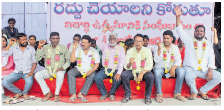
జనగామలో సాదిక్ ఫౌండేషన్ ఆధ్వర్యంలో నిరాహార దీక్షలో పాల్గొన్న విద్యార్థి సంఘాలు