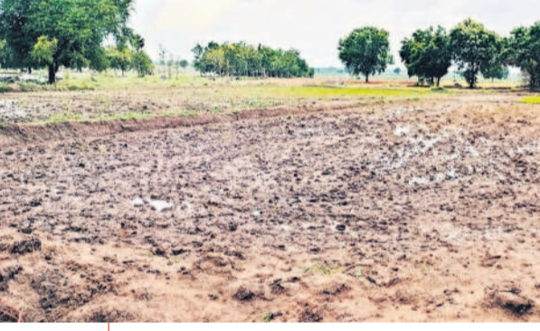
నీటి పంపింగ్ లేక ఎండిన దుస్థితి

ట్రాన్స్ఫార్మర్ కాలి 15 రోజులైతే నారుముడి, దుస్థితి గడ్డ కట్టలేక వైద్యుల వద్దకు వెళ్తున్న రైతులకు వైద్యం అందుకోవడం వారికి ఒక అడ్డంకిగా మారింది. ట్రాన్స్ఫార్మర్ కాలిపోయి పక్షం రోజులైంది. దీంతో ఐదుగురు రైతులకు చెందిన సుమారు 15 ఎకరాలకు మోటార్ల ద్వారా నీరు పెట్టలేక పంటలు ఎండిపోతున్నాయి. మరోవైపు దుస్థితి గడ్డ కట్టలేక వైద్యుల వద్దకు వెళ్తున్న రైతులకు వైద్యం అందుకోవడం వారికి ఒక అడ్డంకిగా మారింది.