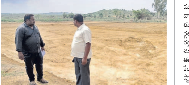
చదును చేసిన స్థలాన్ని పరిశీలిస్తున్న వ్యవసాయ శాఖ అధికారులు

నాగెర్పేట, జూన్ 22: మూల్యమైన విత్తన క్షేత్రంలోని సర్వేనంబర్ 835లో ఉన్న భూమిని గుర్తు తెలియని వ్యక్తులు చదును చేశారు. విషయం తెలుసుకున్న విత్తన క్షేత్రం ఏడీ ఏ.వీ.రామ్మోహన్ శనివారం పరిశీలించారు. ఈ సందర్భంగా ఆయన మూల్యమూలం, విత్తన క్షేత్రంలో పదావుగా ఉన్న తుమ్మల కుంట చేయపు పక్క భూములను రాత్రి వేళలో గుర్తు తెలియని వ్యక్తులు చదును చేశారన్నారు. రాత్రి వేళలో పనిచేయడంతో విషయం వెంటనే బయటికి రాలేదన్నారు. విత్తన క్షేత్రం భూములను అక్షమంగా సాగుచేయడానికి ప్రయత్నిస్తే తీసుకోవలసిన సమాధులు చేస్తామని హెచ్చరించారు. భూమి చదును చేసిన విషయాన్ని కలెక్టర్ దృష్టికి తీసు వెళ్లమని తెలిపారు.