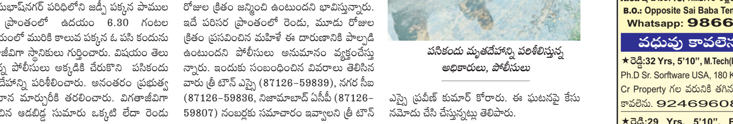
పసికందు మృతదేహాన్ని పరిశీలిస్తున్న అధికారులు, పోలీసులు

ఎస్పీ ప్రవీణ్ కుమార్ కోరారు. ఈ ఘటనపై కేసు నమోదు చేసి చేస్తున్నట్లు తెలిపారు.