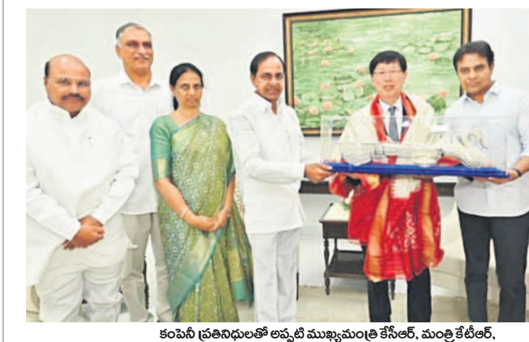
కంపెనీ ప్రతినిధులతో అప్పటి ముఖ్యమంత్రి కేసీఆర్, మంత్రి కేటీఆర్, మంత్రులు హాబీశాపు, నజరాని, ఎమ్మెల్యే కిషన్ రెడ్డి (డ్రైట్)

విద్యుత్ నెట్ వర్క్ నిర్వహణలో నిర్లక్ష్యం కరెంటు సరఫరాలో తరచూ అంతరాయాలు క్షేత్ర స్థాయిలో లైన్ల తనిఖీకి సీఎంఐ ఆదేశాలు వివరాలను ప్రత్యేకంగా అభివృద్ధి చేసిన మొబైల్ యూనిట్ నమోదు చేయాలని సూచించారు. క్షేత్ర స్థాయిలో సూపరింటెండెంట్ ఆంజివీర నుంచి మొదలు కొని ఆర్జిఎస్ వరకు తిరిగి విద్యుత్ వినియోగదారులను కలుసుకొని సమస్యలను తెలుసుకునే ఈ మొబైల్ డైవీస్ నిర్వహించవచ్చు. కొత్తగా చేపడుతున్న క్షేత్ర స్థాయి పరిశీలనతో 11 కేబి లైన్లలో ప్రతి అంతాన్ని పరిశీలించి.. వివరాలను నమోదు చేయవచ్చు. ఆడీవి డంగా ఎల్ఈ, 93 కేబి లైన్లను పరిశీలించి సమస్యలు ఎక్కడ వస్తున్నాయో గుర్తించవచ్చు. మొత్తంగా విద్యుత్ సరఫరాలో అంతరాయం లేకుండా ఉండేందుకు పటిష్టమైన కార్యాచరణతో ముందుకెళ్లాలని ఎన్ఈలకు సీఎంఐ ఆదేశించారు.