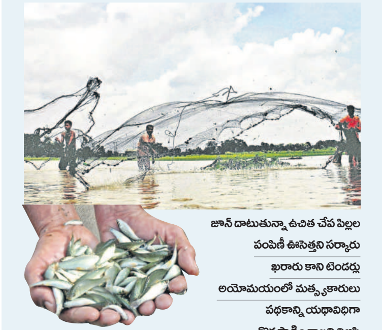
జూన్ దాటుతున్నా ఉచిత చేప పిల్లల పంపిణీ ఉపాధి కార్యక్రమం ఖరారు కాని టిందర్లు అయోమయంలో మత్స్యకారులు పథకాన్ని యథావిధిగా కొనసాగించాలని విజ్ఞప్తి

బొంబాయి, జూన్ 22 : టీఆర్ఎస్ ప్రభుత్వం అమలు చేసిన పలు సంక్షేమ పథకాలకు కాంగ్రెస్ ప్రభుత్వం తిరోదాడులు ఇస్తున్నది. కులవ్యత్యాలపై ఆధారపడి జీవించే వారి సంక్షేమానికి గతంలో కేసీఆర్ ప్రభుత్వం అనేక సంక్షేమ పథకాలను అమలు చేసింది. గొల్లకురుమలకు ఉచితంగా గొర్రె పిల్లలను పంపిణీ చేయగా ఆ పథకాన్ని ప్రస్తుత ప్రభుత్వం రద్దు చేసింది. దేశీయ ఆర్థిక అభివృద్ధి కోసం అమలు