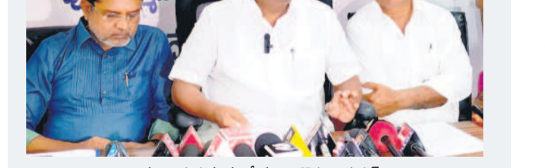
మాట్లాడుతున్న మాజీ మంత్రి కొప్పుల ఈశ్వర్