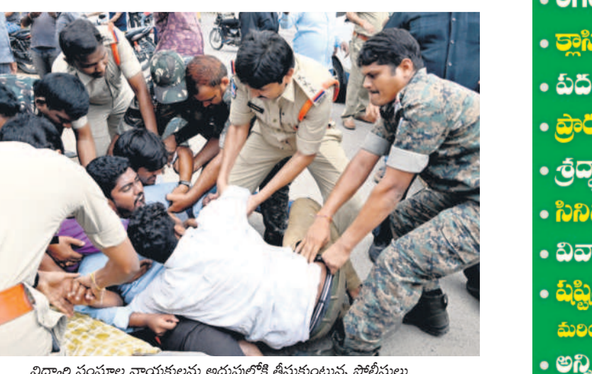
విద్యార్థి సంఘాల నాయకులను అదుపులోకి తీసుకుంటున్న పోలీసులు